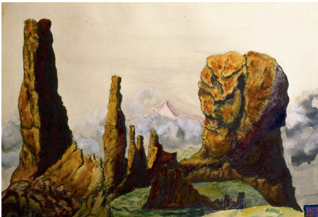
Aleister Crowley Snow-Peak beyond Foothills, Libra 18 / September-October 1934 Bolígraf i aquarel·la 34,5 x 50 cm © Ordo Templi Orientis

generació deliberada d'estats alterats de la consciència com a via per la creació.