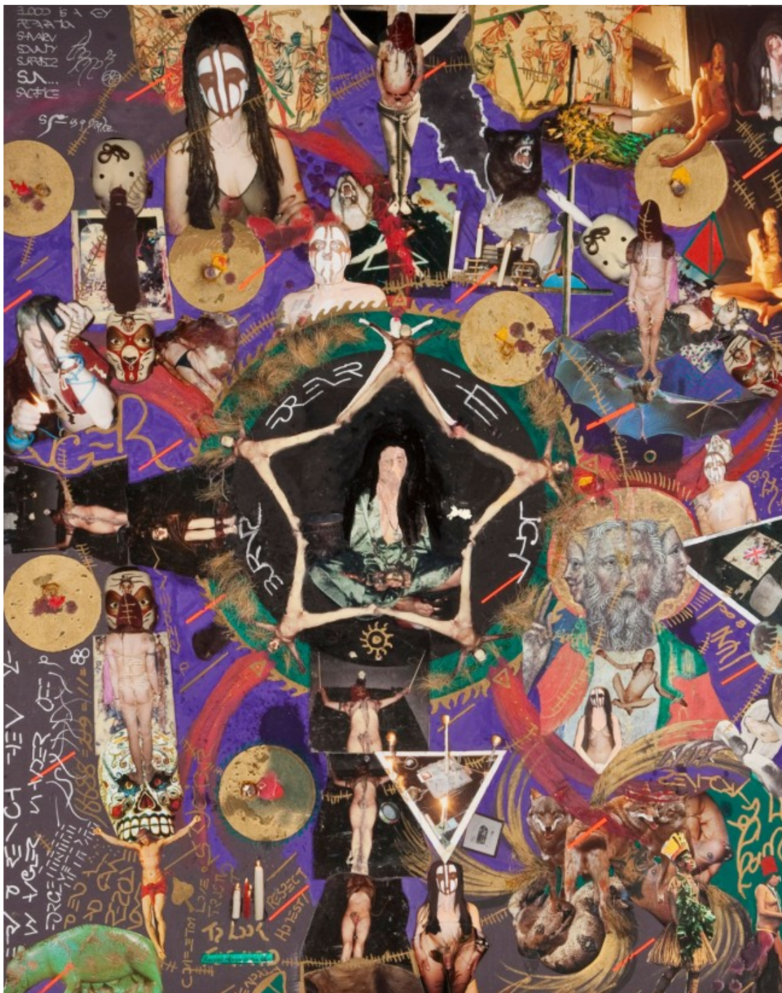
Harry Smith Sense títol, 19 octubre 1951 Tinta, aquarel·la i tempera sobre paper 86,36 x 69,85 cm Col·lecció Raymond Foye, New York

El tram final de l'exposició, potser menys compacte que els dos blocs anteriors, per una qüestió de dispersió que pren tot el sentit amb l'experiència individual que va accentuar la postmodernitat, inclou obres d'artistes com Gino de Dominicis, Genesis P-orridge, Joan Jonas o Derek Jarman, entre d'altres. Cal fer una menció especial a la relació del còmic amb l'ocultisme, portant a l'extrem la