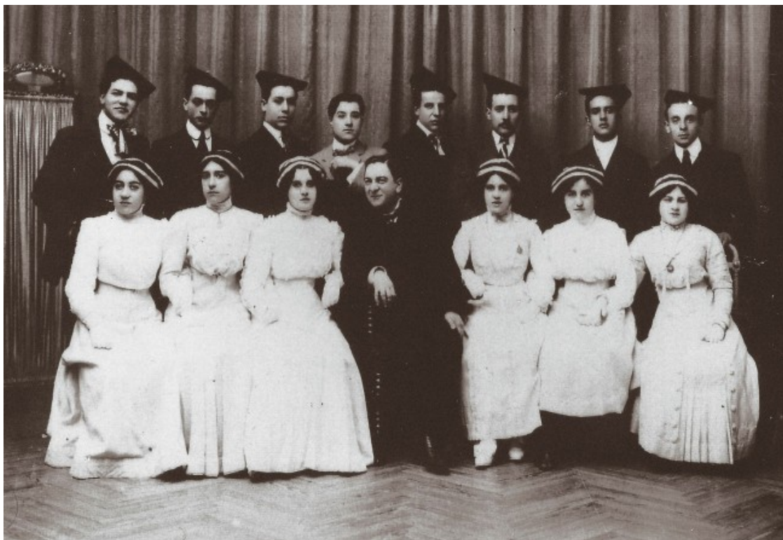
Foto: Aureli Capmany i els components de l'Esbart Català de Dansaires l'any 1910. Esbart Català de Dansaires