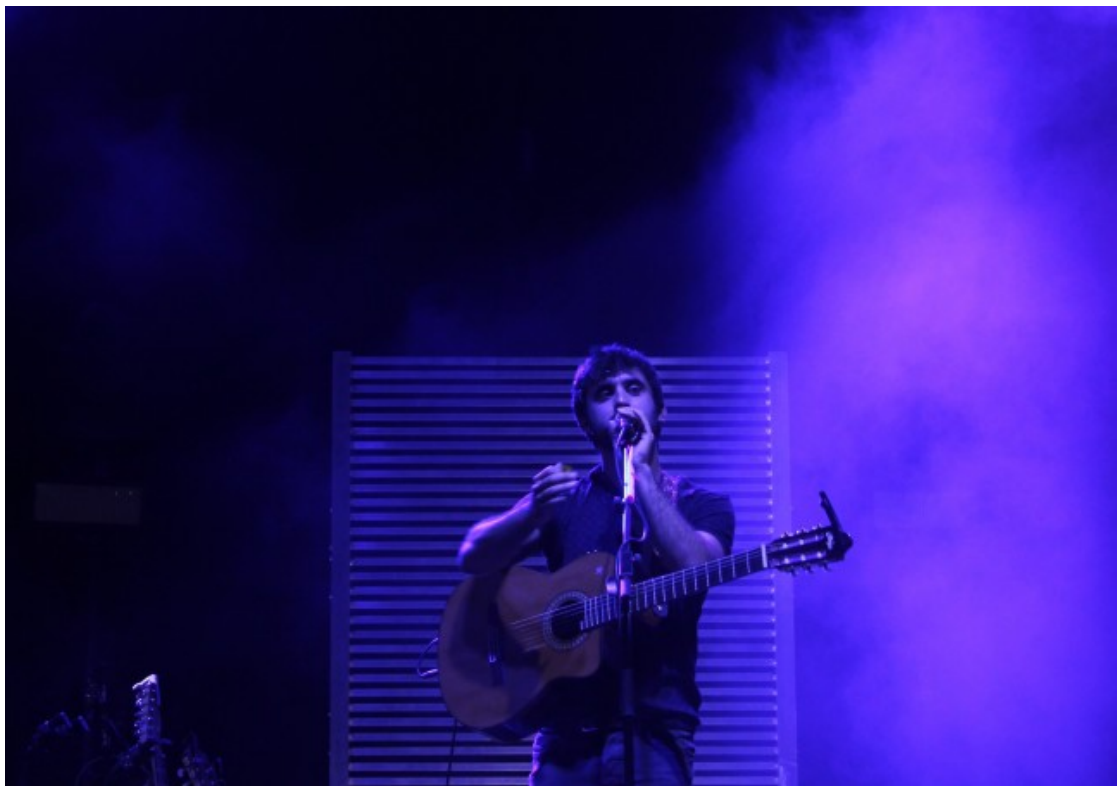
La iaia.