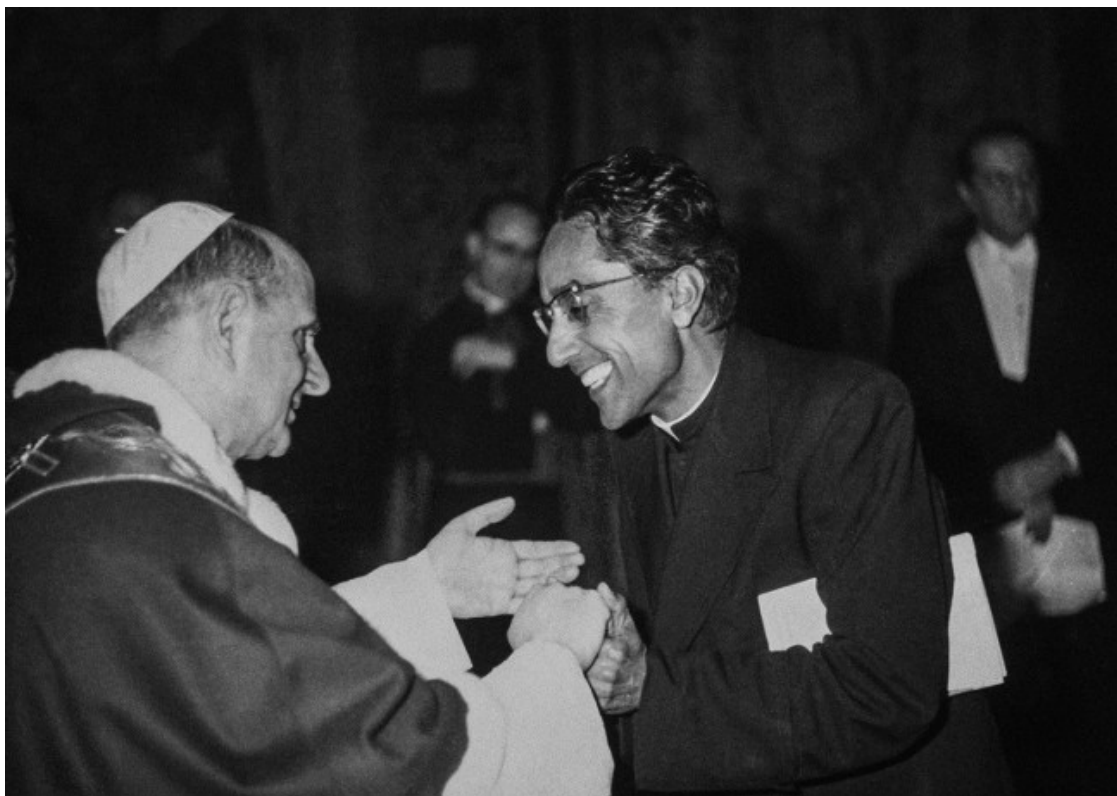
Panikkar amb Pau VI. Roma, Itàlia, 1966