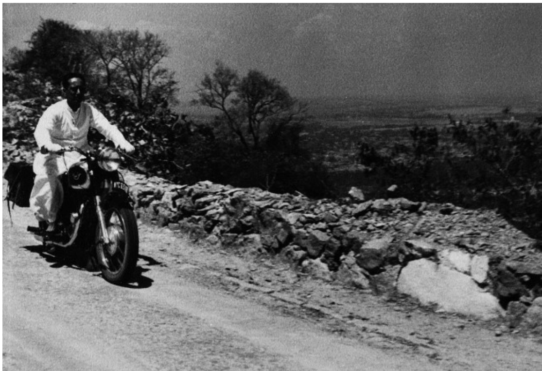
Panikkar descobrint l'Índia en moto, 1957