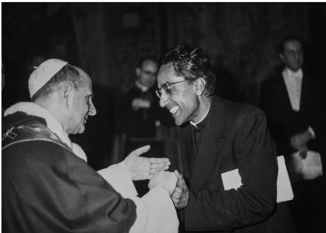
Panikkar amb Pau VI. Roma, Itàlia, 1966