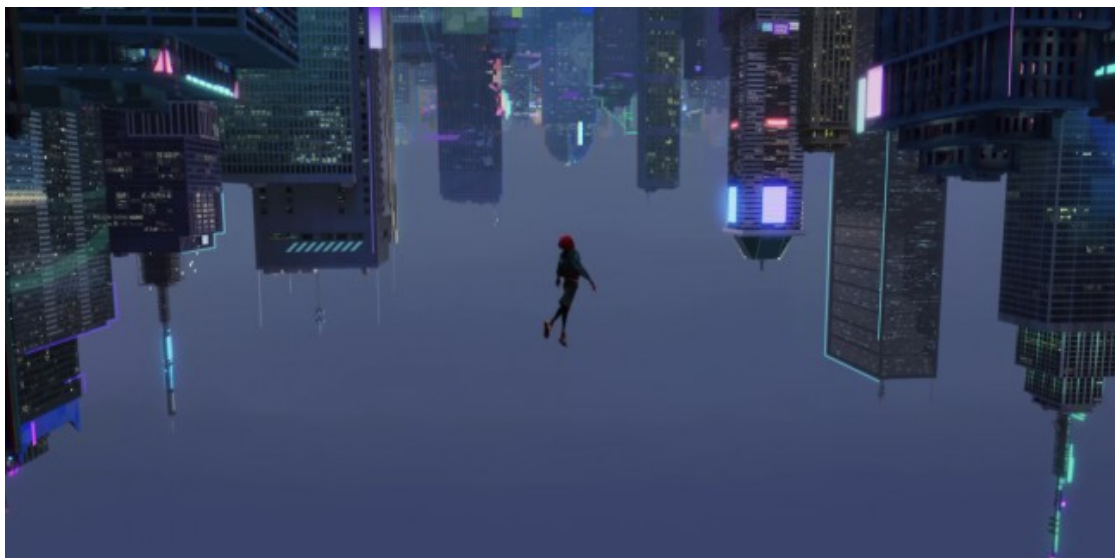
Fotograma de «Spider-Man: Into the Spider-Verse»

"Segur que és molt maca. Però la història està bé? A mi no m'agraden les pel·lis de superherois". Us confesso que a mi tampoc no gaire. Hi veig gent amb roba cridanera fent coses inversemblants. M'ha passat tota la vida. Però aquesta, que alguns ja clamen que és la millor pel·lícula de superherois que s'ha fet fins ara, no és només això. Més enllà del nano disfressat que salta i es penja entre edificis, el film tracta de la relació d'un adolescent amb el nou món dels adults. De la dificultat de triar la pròpia identitat i encaixar en un entorn hostil i ple d'expectatives. De la cerca d'un bon model en què emmirallar-se. Ens parla de la diversitat com una riquesa a defensar, un bé comú. Aquí val la pena que ens aturem un moment.