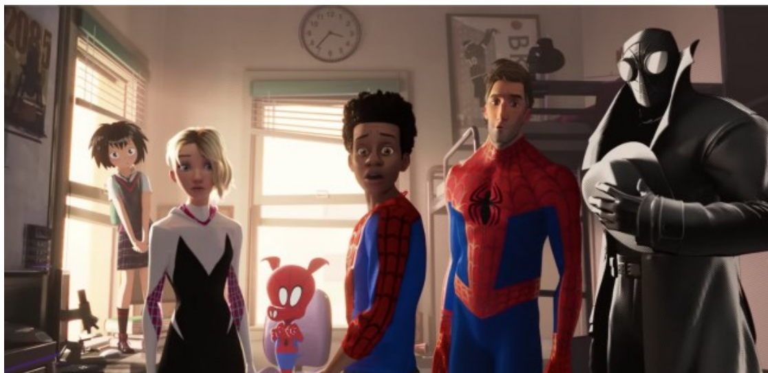
Fotograma de «Spider-Man: Into the Spider-Verse»

Alguns ja clamen que és la millor pel·lícula de superherois que s'ha fet fins ara