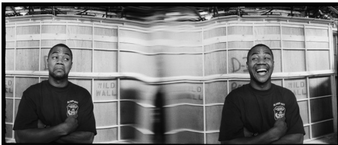
Cuba Gooding Jr., Blown Away

Repassar la carrera de Bridges -que amb els anys ha anat adquirint una aparença de lleó majestuós i savi, de cowboy de tornada de tot- és conèixer també unes quantes dècades de cinema nord-americà. La seva col·laboració amb John Huston a Fat City (1972) el va permetre entroncar amb el Hollywood clàssic, mentre que ha treballat amb bona part dels directors de la generació que va renovar el cinema als anys setanta: Michael Cimino, Peter Bogdanovich, John Carpenter, Hal Ashby, Francis Ford Coppola, Ridley Scott, Walter Hill... Amb Tron (1982) va formar part d'un títol pioner a utilitzar imatges generades per ordinador i, més endavant, els esmentats Coen el van convertir en un emblema de la postmodernitat. Recentment s'ha deixat veure per les superproduccions de Marvel ( Iron Man ) i, encara ara, joves autors cridats a aportar sang fresca al cinema de gènere li han regalat papers suculents en títols com Comancheria i Malos tiempos en El Royale . Jeff Bridges segueix sent venerat i respectat i sembla difícil trobar algú a qui caigui malament,