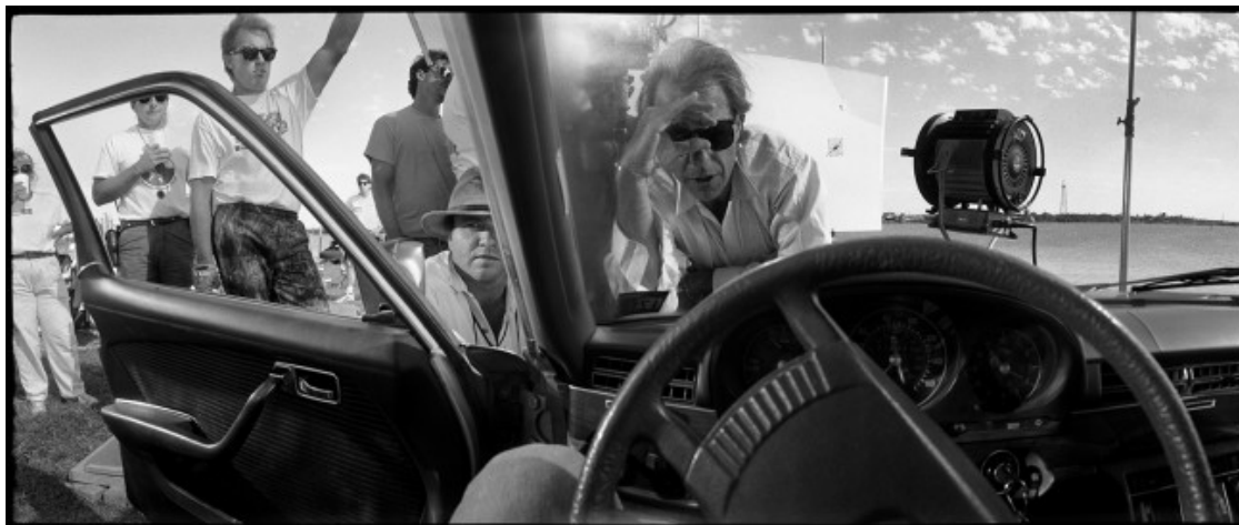
Peter Bogdanovich Lines Up a Shot, Texasville

Repassar la carrera de Bridges -que amb els anys ha anat adquirint una aparença de lleó majestuós i savi, de cowboy de tornada de tot- és conèixer també unes quantes dècades de cinema nord-americà. La seva col·laboració amb John Huston a Fat City (1972) el va permetre entroncar amb el Hollywood clàssic, mentre que ha treballat amb bona part dels directors de la generació que va renovar el cinema als anys setanta: Michael Cimino, Peter Bogdanovich, John Carpenter, Hal Ashby, Francis Ford Coppola, Ridley Scott, Walter Hill... Amb Tron (1982) va formar part d'un títol pioner a utilitzar imatges generades per ordinador i, més endavant, els esmentats Coen el van convertir en un emblema de la postmodernitat. Recentment s'ha deixat veure per les superproduccions de Marvel ( Iron Man ) i, encara ara, joves autors cridats a aportar sang fresca al cinema de gènere li han regalat papers suculents en títols com Comancheria i Malos tiempos en El Royale . Jeff Bridges segueix sent venerat i respectat i sembla difícil trobar algú a qui caigui malament,