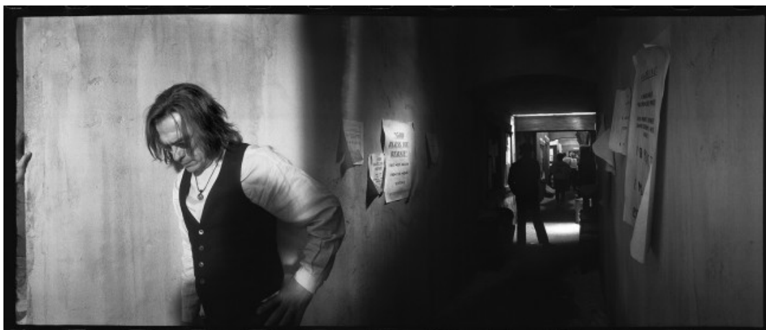
Tommy Lee Jones, Blown Away

Jeff Bridges controla sempre personalment tot el procés de realització i revelat d'aquestes imatges panoràmiques i en blanc i negre, on recull els seus companys treballant en els rodatges i també moments morts i de distensió. A l'exposició Lebowski i altres grans instantànies hi ha dos grans blocs dedicats a El gran Lebowski i a Tormenta blanca , un altre amb fotos preses en d'altres films i un altre en el qual retrata actors mentre juguen a fer expressions facials contraposades. També es pot veure l'afició de Bridges a fer-se selfies en els rodatges ja des de molt abans que hi hagués telèfons mòbils.