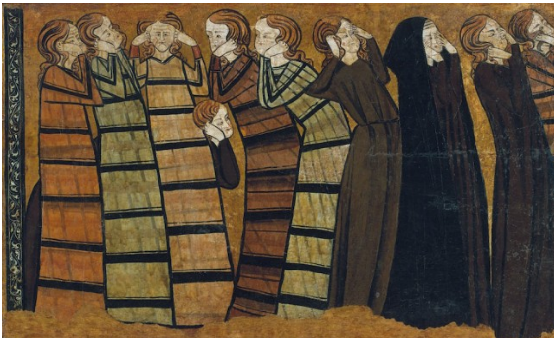
Anònim. Castella, Plorans , c. 1295. MNAC. Museu Nacional d'Art de Catalunya, Barcelona © Museu Nacional d'Art de Catalunya, Barcelona, 2019.

I l'art ha estat el territori ideal per a la representació dels afectes al llarg dels segles i ho continua sent. L'emoció està en la mateixa gènesi de la creació, en l'artista, i des d'allà es transmet a l'espectador. La música seria l'art, diguem-ne, més directe pel que fa a la connexió emotiva però les arts visuals no es queden gens curtes. Aquest és el tema que explora l'exposició Poètiques de l'emoció ( https://caixaforum.es/ca/barcelona/fichaexposicion?entryId=812835 ), que es pot veure fins al 19 de maig a CaixaForum Barcelona i que fa dialogar obres contemporànies amb peces d'altres èpoques, tant de la Col·lecció La Caixa com d'altres prestadors.