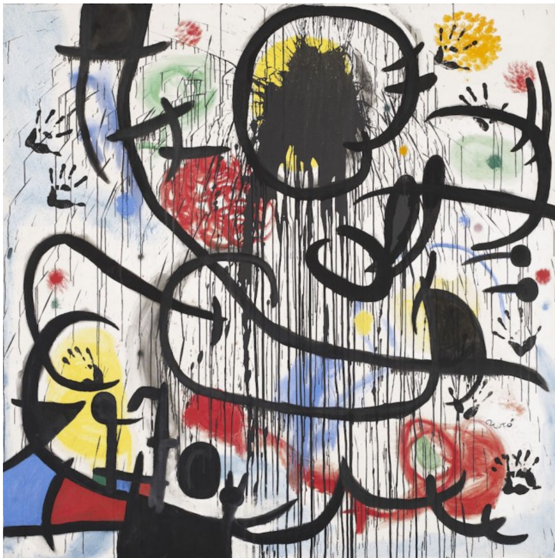
Joan Miró, Mai 1968, Maig del 1968 - desembre del 1973. Fundació Joan Miró, Barcelona

Un diàleg entre obres de totes les èpoques per a explorar la representació dels sentiments