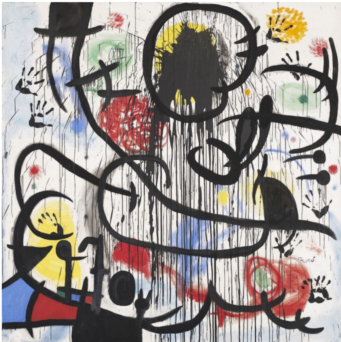
Joan Miró, Mai 1968, Maig del 1968 - desembre del 1973. Fundació Joan Miró, Barcelona

Un diàleg entre obres de totes les èpoques per a explorar la representació dels sentiments