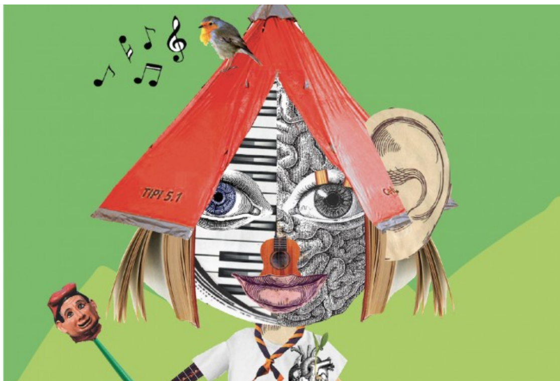
La Casa de la Carlota

La Fundació Carulla convoca entitats i monitors a presentar projectes de transformació social