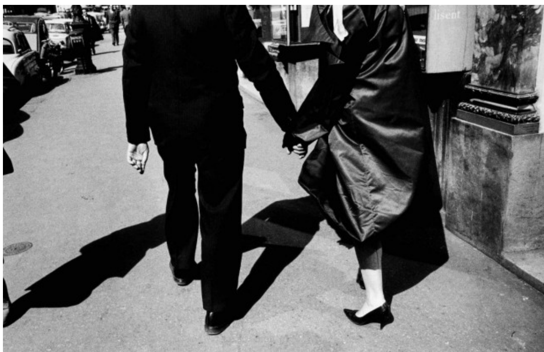
Gabriel Cualladó. París, 1962.

Les 140 fotografies que es poden veure a La Pedrera, algunes ampliades per cobrir panys de paret sencers, com l'autoretrat amb samarreta que dona la benvinguda a l'exposició, parlen per un home que va descobrir en la fotografia una capacitat d'expressió que sembla que no havia trobat en les paraules. Una de les parets s'ha vestit amb una versió immensa de la fotografia d'una mà que reposa sobre el marc d'una finestra - Cerveseria alemanya, Madrid, 1960 - que amb la llibertat d'observadora guardo al costat d'una de les meves fotografies preferides d'André Kertész ( https://i.pinimg.com/236x/b3/1d/0e/b31d0e170b41e5629030a4f9592d46de--andre-kertesz-white-photography.jpg ), on també una mà surt d'algun lloc cap a l'exterior. Aquesta confrontació de monòlegs, el de Cualladó i el de qui l'observa, ressona constantment durant l'exposició.