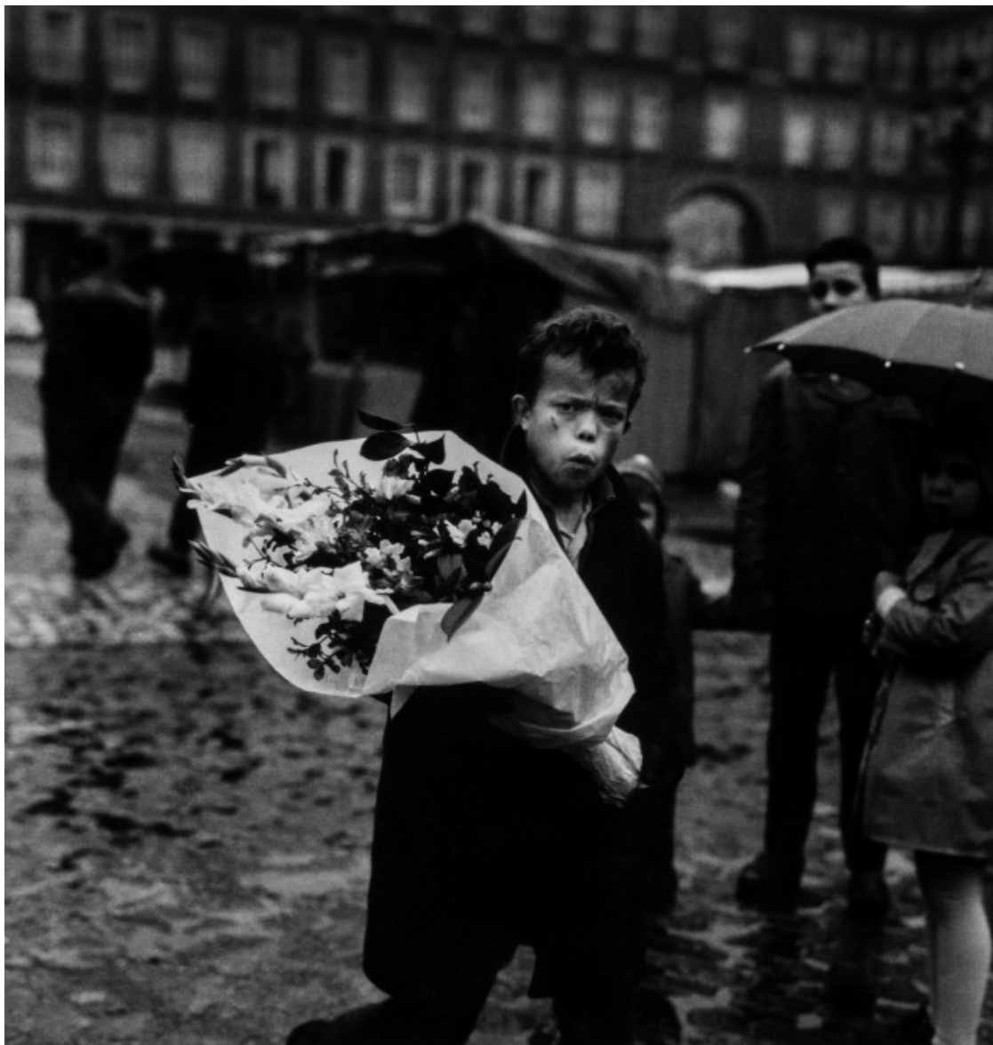
Gabriel Cualladó. Nen amb ram de flors. Plaza Mayor, Madrid, 1959

Un recorregut de caràcter antològic per l'obra de Gabriel Cualladó, un dels renovadors de la fotografia a l'estat espanyol durant la segona meitat del segle XX.