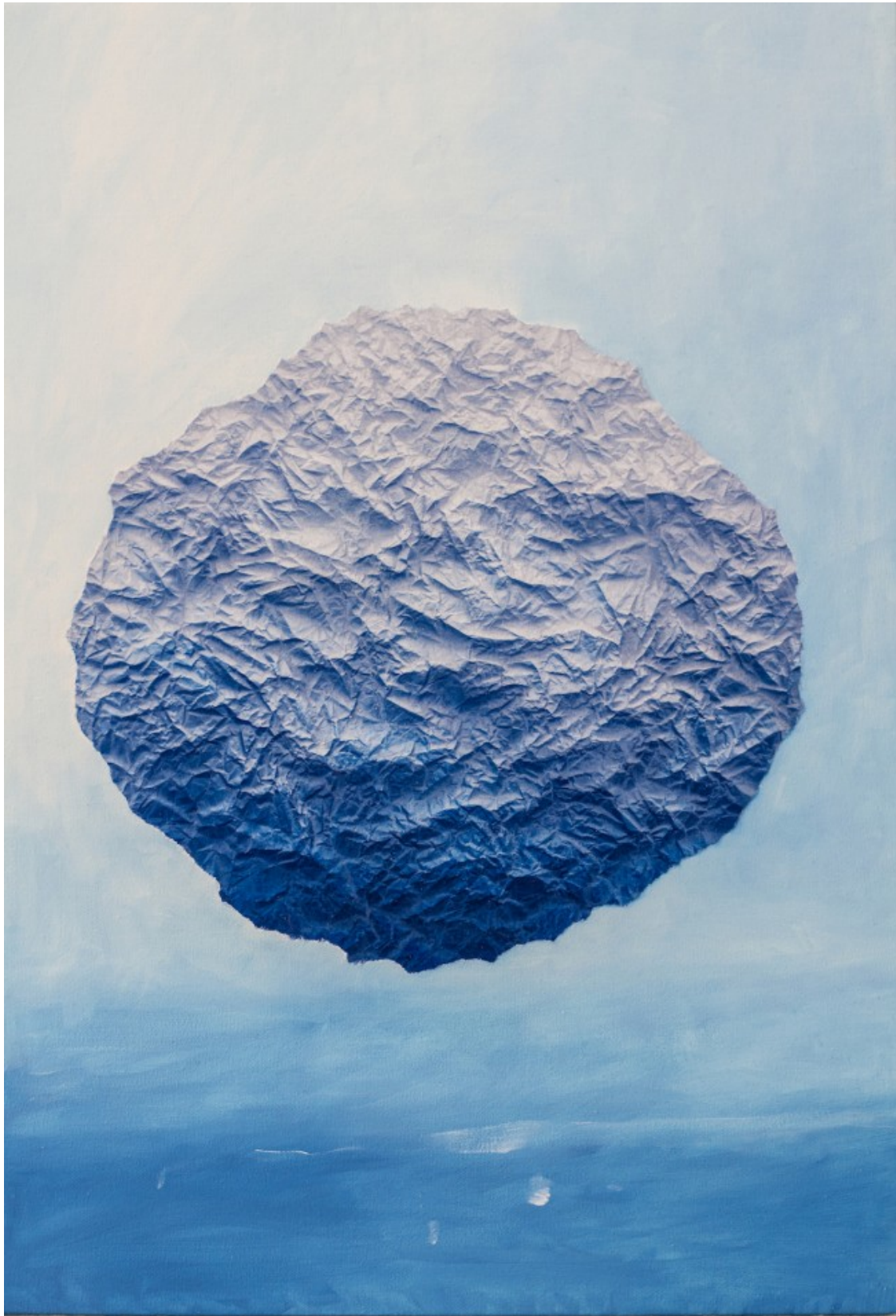
"I et seguire? tot d'una", 2017-2018