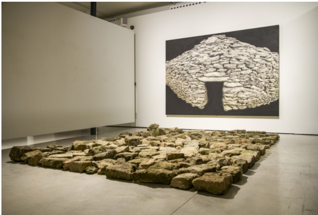
La pell de l'amnèsia, 2014

Fulla les ha trobades, les ha documentades i les ha pintades, pedra a pedra, amb una actitud metòdica, disciplinada, zen. Però ens diu que "les cabanes són només una excusa per anar afrontant territoris més universals. Més que les pedres el que m'interessen són les portes i el misteri del salpebrat que creen aquestes construccions en el paisatge. Són elements que han tingut una funció, però que tu ja no els mires sota aquesta funció perquè no pertanys al territori. Estan entre la cova, la protecció, l'aïllament. Et fan demanar-te: traspasso aquesta frontera o no la traspasso?"