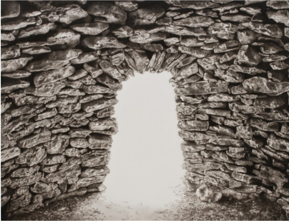
Cabana 785. Sèrie construccions.