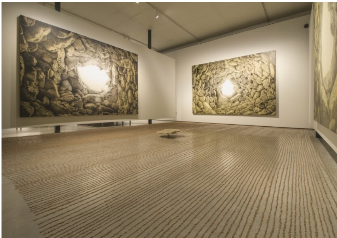
L'habitacio? del gra, 2019