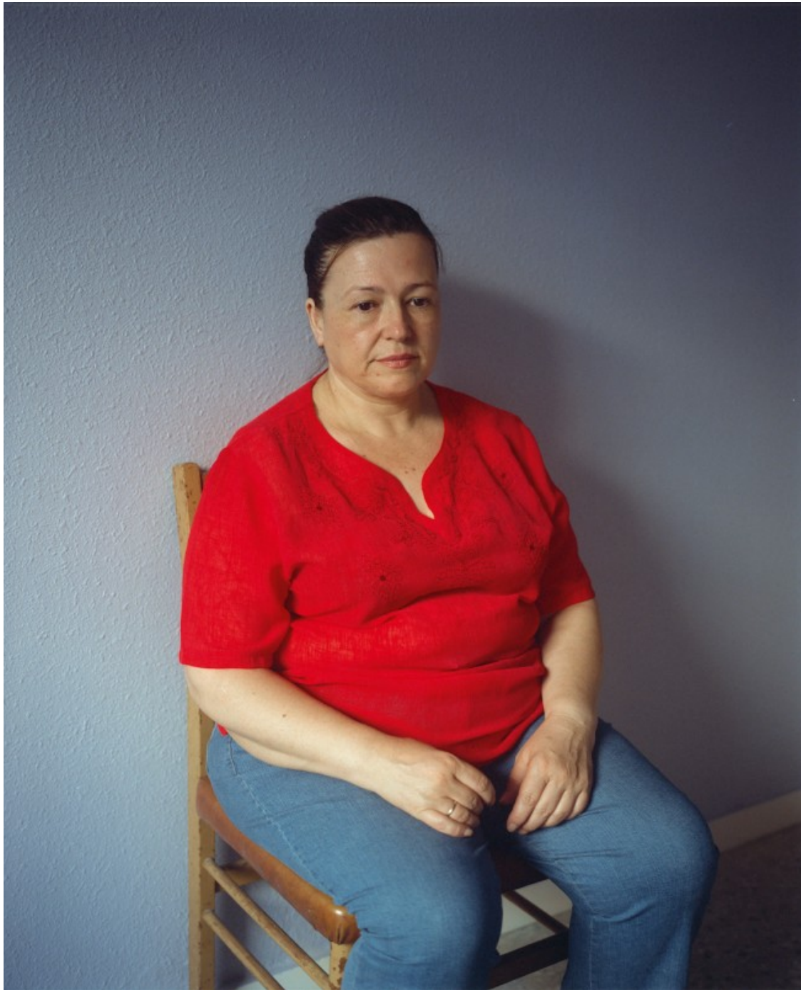
Mati, 48 anys. El Prat.