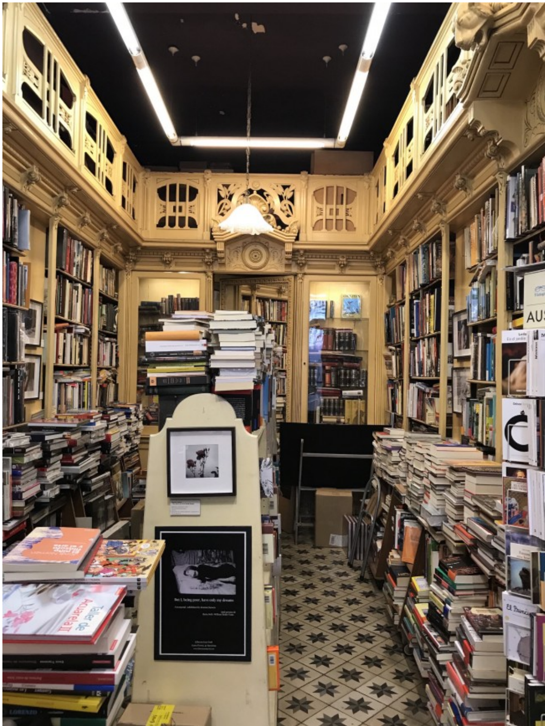
Libreria Sant Jordi

Si et dediques a aquest ofici i vols formar part de la nostra secció La llibreria llegeix