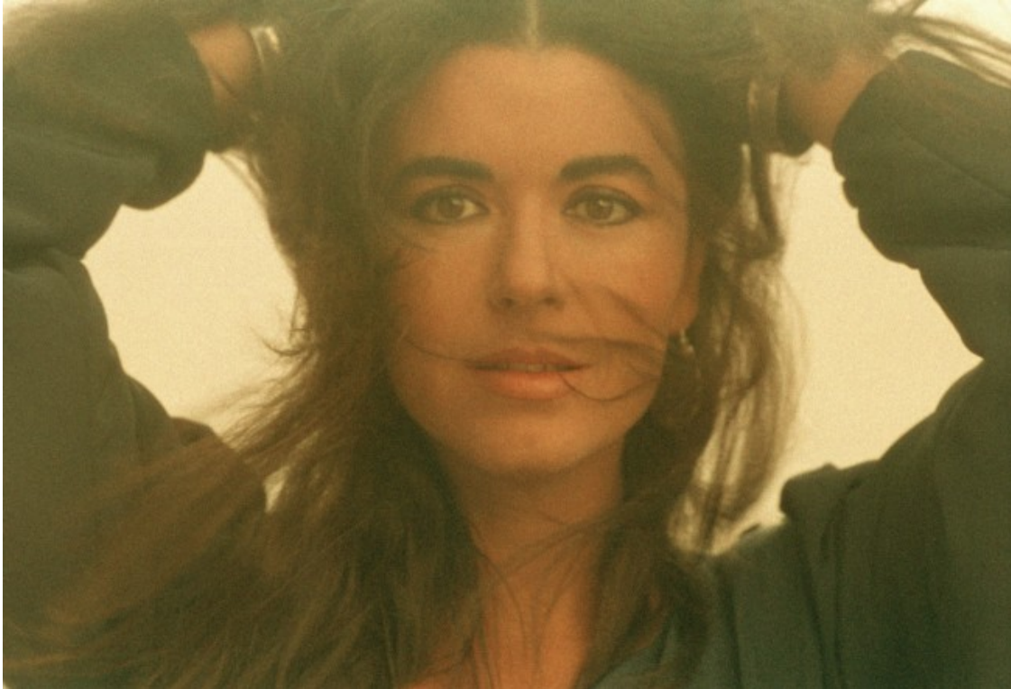
1985, contraportada del disc "Anells d'aigua"