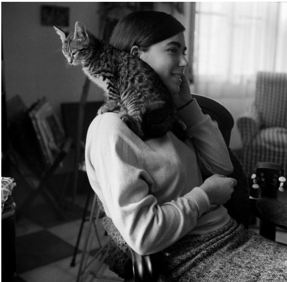
Primera fotografia feta a Palma el 1966

Una exposició del Palau Robert commemora l'amistat dels dos creadors