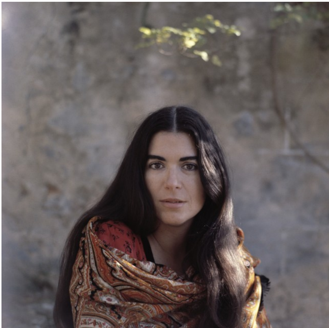
1981, fotografia del disc " Jardi? tanca! "

La mostra Maria del Mar Bonet als ulls de Toni Catany ( http://palaurobert.gencat.cat/ca/exposicions/sala1/2019/MMB/ ) , mitjançant 180 obres, entre discos, cartells i fotografies, presenta aquella estreta relació professional i fraternal que va començar als anys 60 i que va ser testimoni de molts esdeveniments culturals i històrics. La discografia de Maria del Mart Bonet és el fil conductor de l'exposició, que està estructurada en els àmbits següents: Una mirada enamorada , Als ulls de l'amic , Salmaia i Retrats .