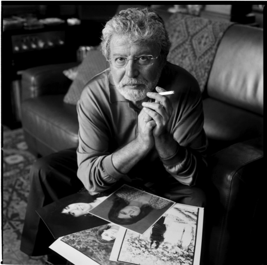
Toni Catany, 2007