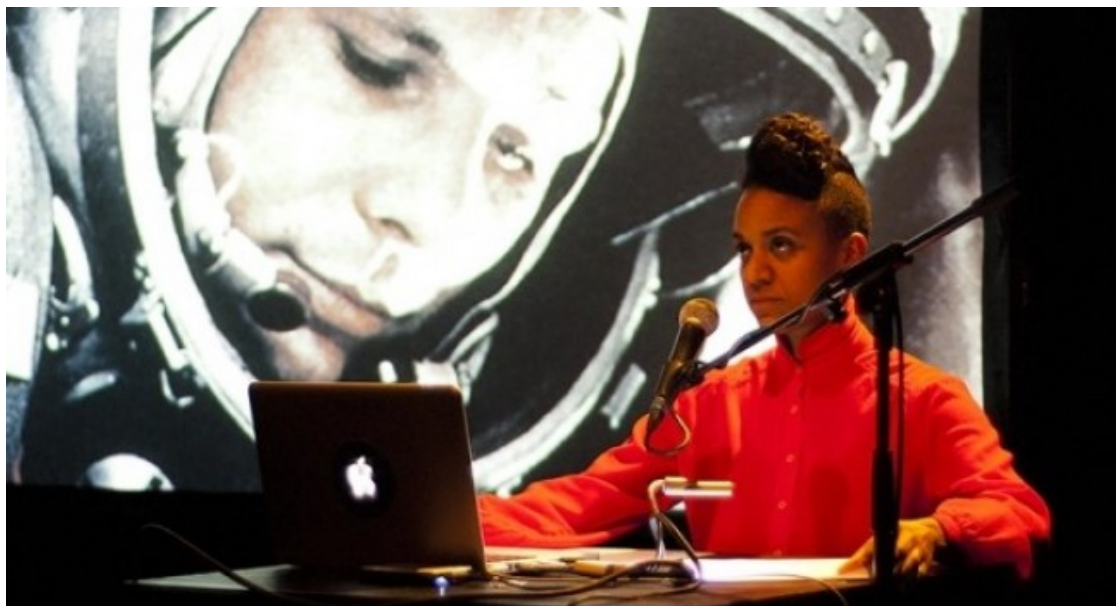
Kapwani Kiwanga, «Afrogalàctica: Breu història del futur, 2012-en curs» (2014).

El Macba programa una jornada sobre l'empremta de la repressió i la desposseïó colonial