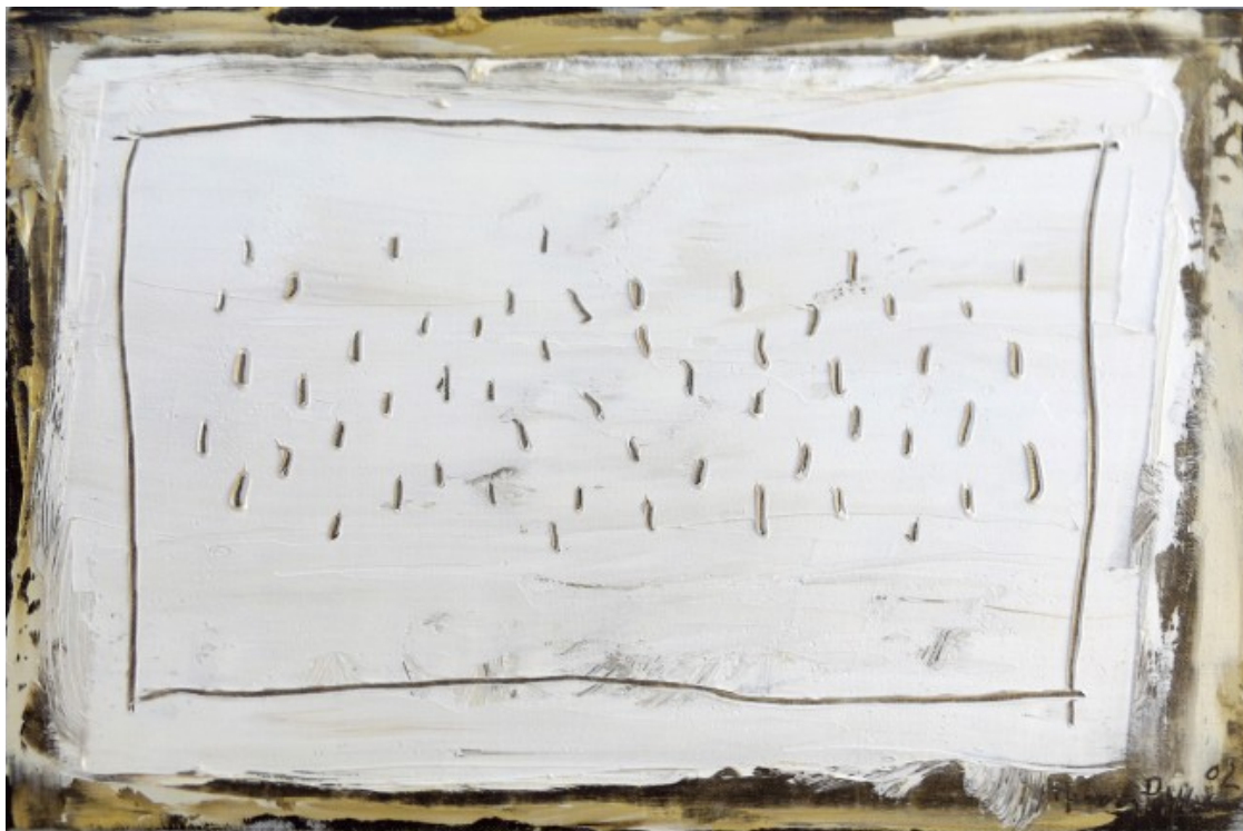
Joan Hernández Pijuan. "Caminant" (2002). Oli sobre tela. 44x55cm.