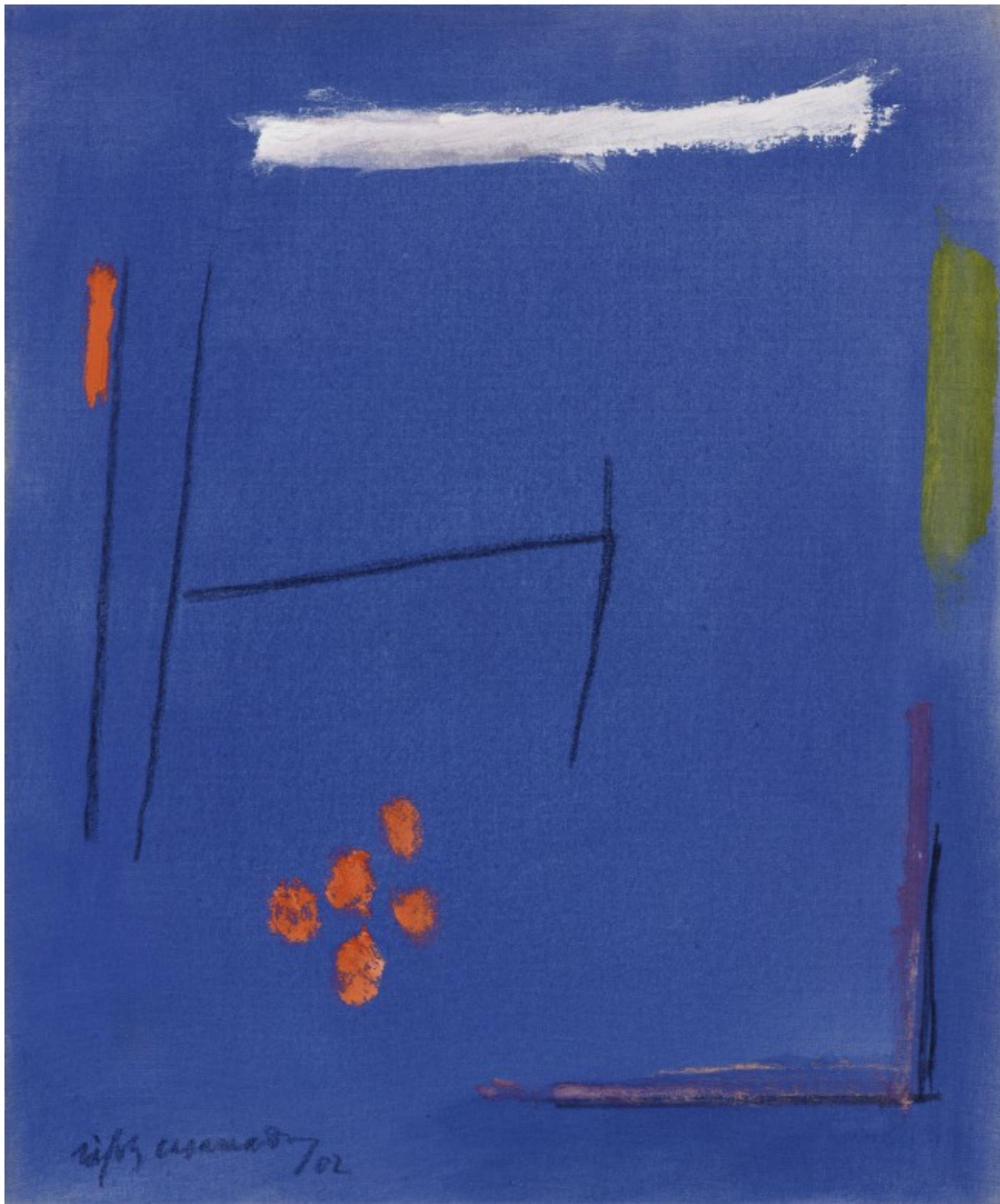
Albert Ràfols-Casamada. "Espai blau" (2002). Acrílic i pigments sobre tela. 46x38cm.

Col·lecció Ars Citerior. Una manera de veure ( https://www.fundaciovilacasas.com/ca/exposicio/una-manera-de-veure )