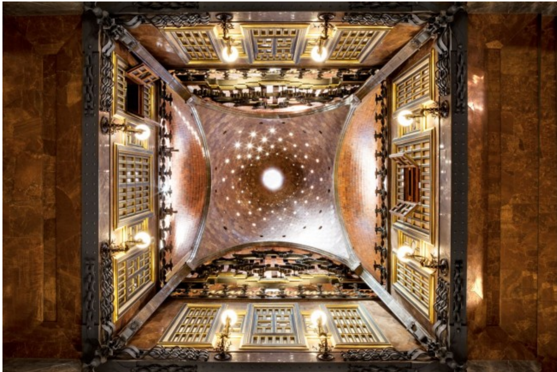
Vista de la cúpula des del saló central.

Un dels espais més emblemàtics del conjunt és la cavallerissa que es troba al soterrani i que alhora fa les funcions de fonament de tota l'estructura. Però és el terrat, amb l'agulla central sobre el saló envoltada de quatre àmplies obertures parabòliques que s'obren a la recerca de la llum natural, un dels punts més espectaculars del Palau. El coronen vint xemeneies amb què Gaudí va transformar, per primera vegada, els fumerals de les llars de foc i els conductes de ventilació tradicionals en escultures màgiques i policromades. A més, en la majoria s'hi pot apreciar l'ús de la tècnica del trencadís, que més tard faria servir en tants d'altres projectes.