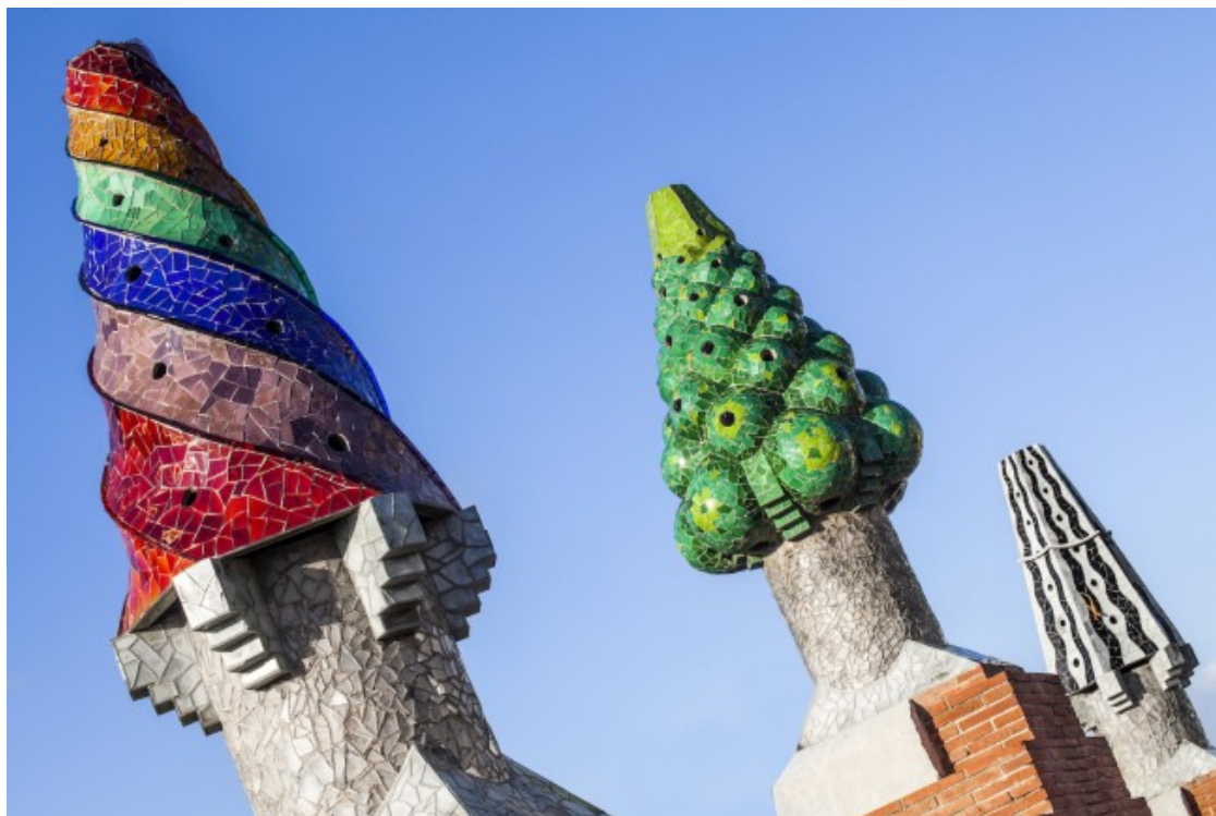
Detall de les xemeneies del Palau Güell.

La Diputació de Barcelona convida a conèixer aquest encàrrec de joventut de Gaudí