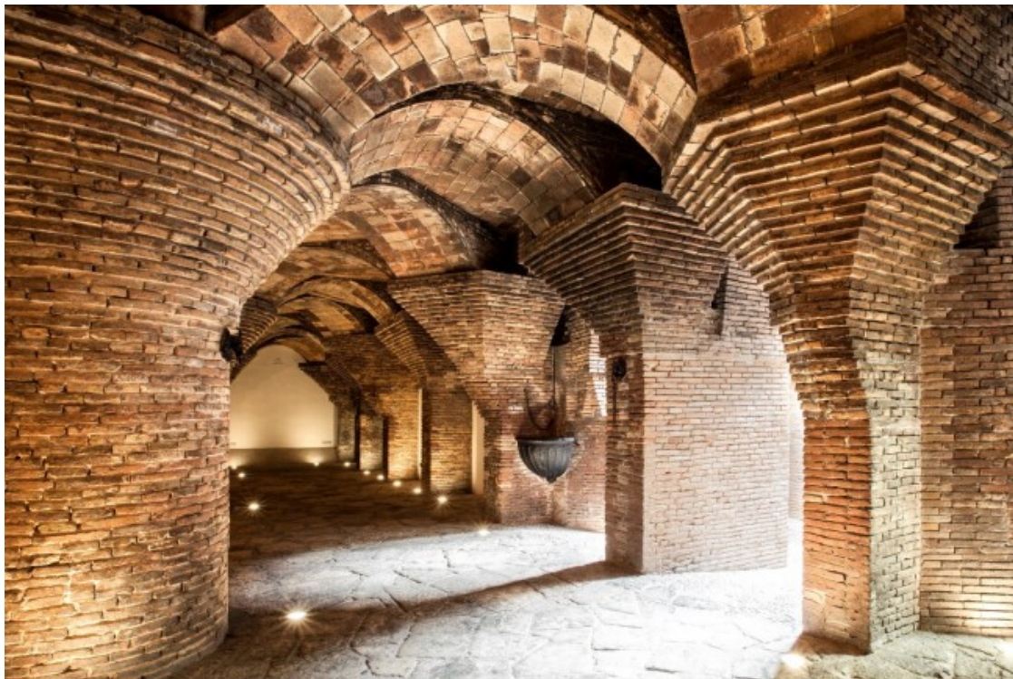
Les cavallerisses, a la planta soterrània.