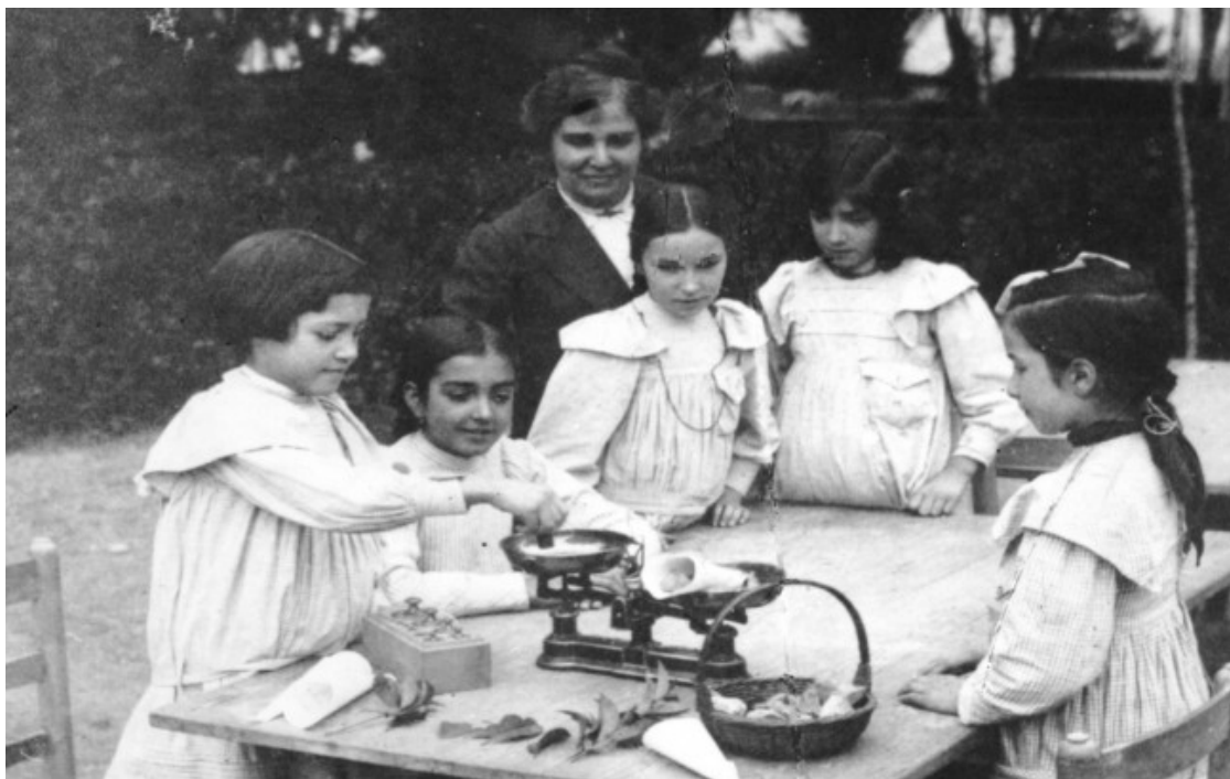
Foto: Matemàtica viva a l'aire lliure a l'Escola del Bosc de Montjuïc, una escola activa en plena natura amb Rosa Sensat al capdavant.

El que farà més per Catalunya serà el més bon educador dels seus fills. Amor, respecte i desinterès podrien donar unes masses ciutadanes educades i lliures.