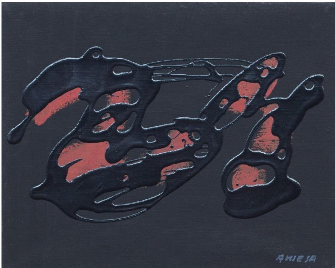
Carmine sings , 1991, Acrílic/tela, 20,4 x 25,2 cm

El negre, el color que en diverses gradacions conforma la base del seu univers pictòric, ens envolta, però això no vol dir que no hi hagi colors a les peces i de vegades de ben brillants, com quan clava centenars d'agulles de cap pintades de verd i porpra en la sensual pintura Camps d'olor (2012). En un negre que sorgeix després de desenes de capes de pintura, Ansesa sempre ha quadriculat la tela prèviament per planificar molt bé el que vol pintar. Els números apareixen sovint també en llargues llistes de punts: "Són els morts i en altres casos són llistats de nínxols". Hi ha alguna cosa de matemàtic en el seu procés i és que la ciència és molt important a la seva vida: "Si no hagués estat pintor, hauria estat físic. Des de petit i encara ara, continuo llegint llibres de física, perquè la física és la filosofia de les realitats, que ens ensenya que és tan difícil anar lluny com anar endins, del macro al micro. I el negre, la foscor, és el començament de l'energia".