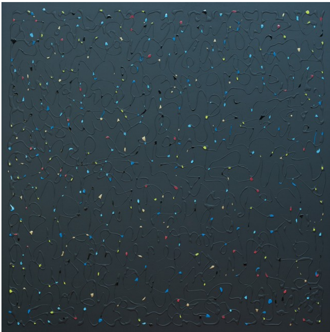
Constel·lació, 2018, Tècnica mixta sobre fusta, 118 x 120 cm

L'exposició, que ha comissariat Toni Álvarez de Arana, explora quatre dels elements formals persistents en tota l'obra del pintor: les cal·ligrafies, les creus, els punts i les sutures. "A l'escola ens castigaven repetint cal·ligrafies, i encara era més difícil fer-ho amb lletra gòtica alemanya. Allò t'acabava donant una facilitat gestual. Al cap i a la fi la pintura no és res més que un esforç per donar forma a la matèria dominant-la i faig cal·ligrafies amb matèria".