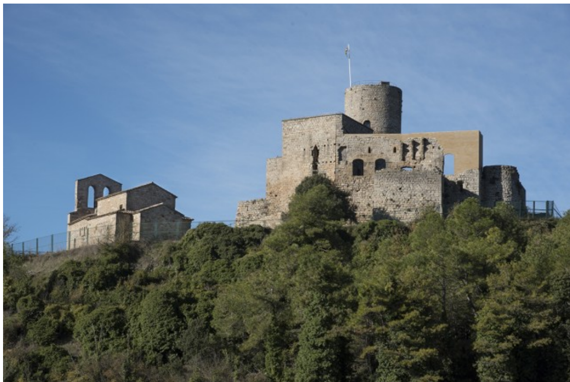
El conjunt monumental del Castell de Boixadors

La Diputació de Barcelona mostra el procés de restauració de diversos conjunts monumentals