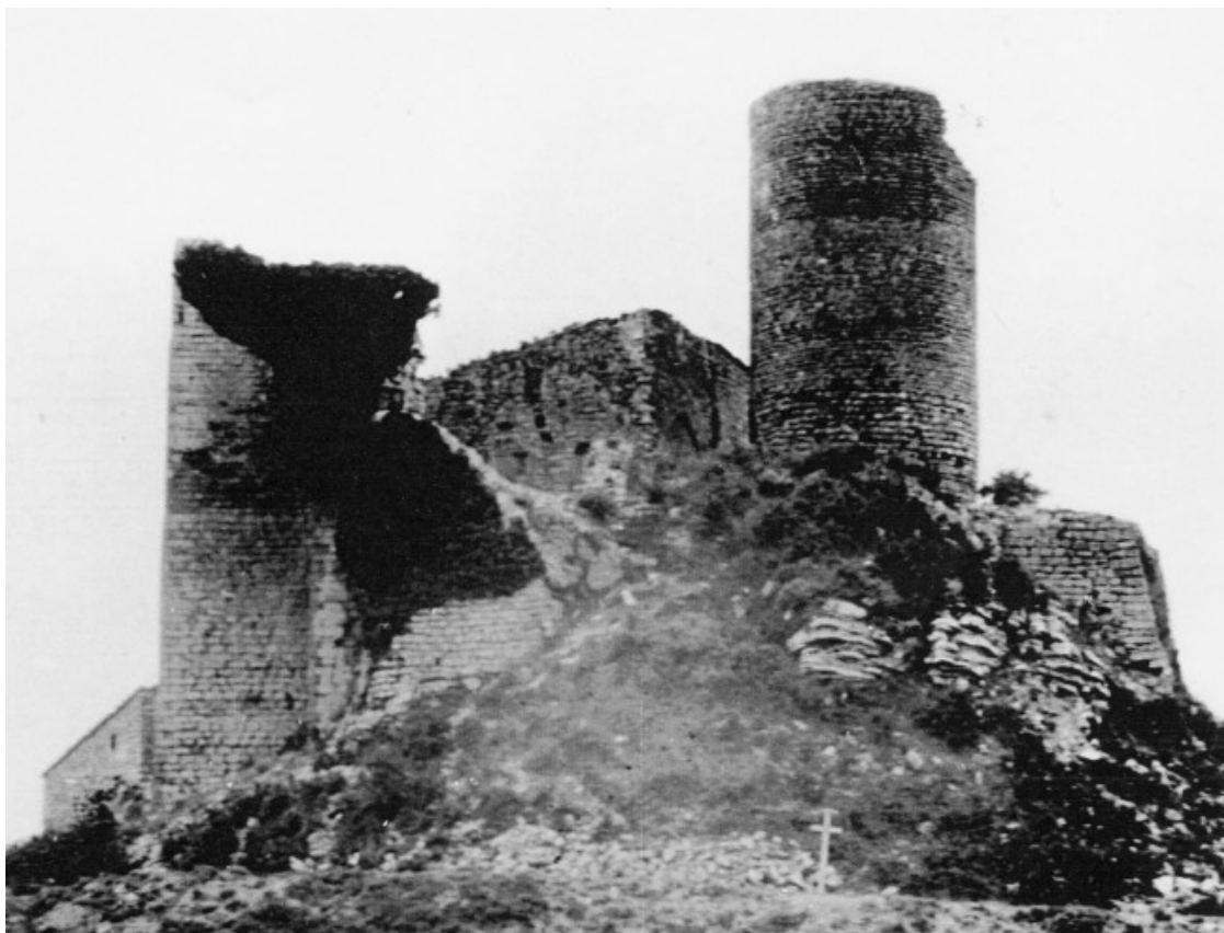
Fotografia de l'any 1906 del conjunt monumental de Sant Pere Sallavinera.

A més dels elements que s'han conservat, s'ha pogut reconstruir la muralla que protegia el castell, a partir d'evidències del seu traçat en el terreny i de fotografies de principis de segle on se'n veia l'estructura. Sobre aquest falsejament, Joan Closa se serveix de l'exemple del pavelló Mies van der Rohe de Barcelona, que és la reconstrucció exacta del que va projectar i construir l'arquitecte per a l'Exposició Universal de 1929, però no el mateix. Si ningú dubta que malgrat que no és l'original el pavelló de Barcelona és autèntic, la muralla del castell de Boixadors també ho és, reproduint l'original que s'ha perdut en el temps.