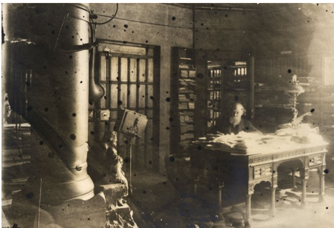
Eusebi Güell al seu despatx del Palau Güell