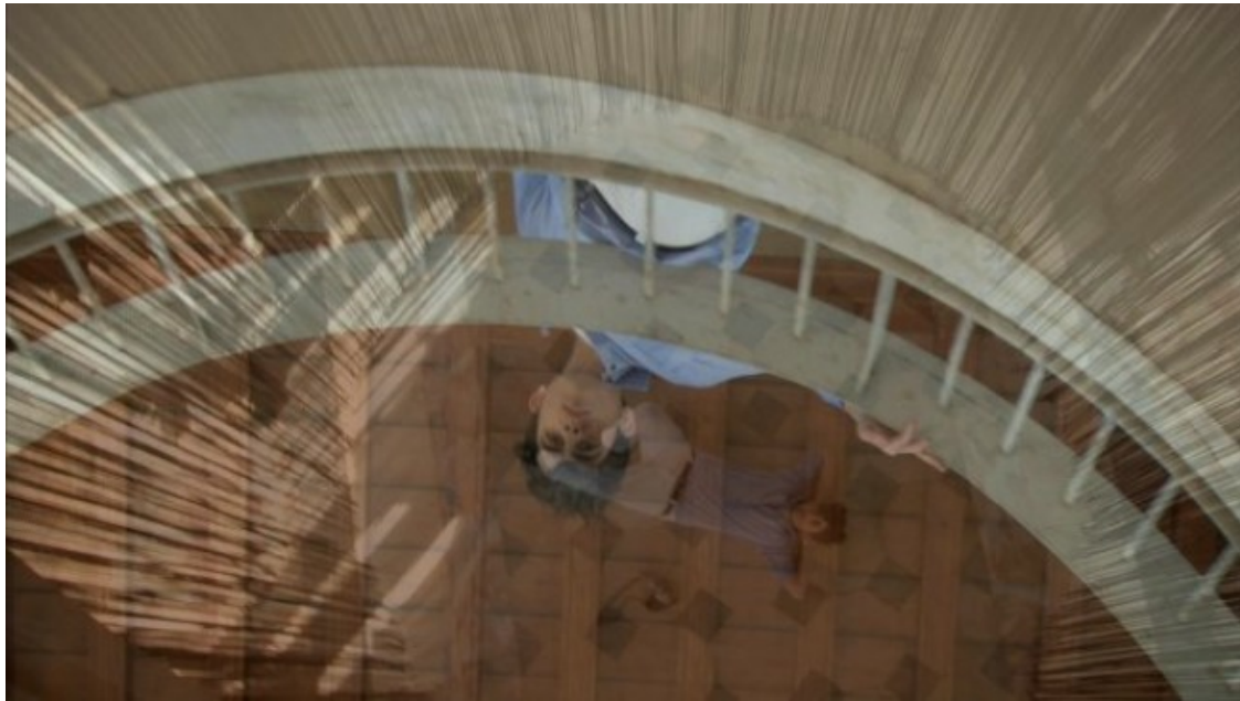
Imatge de A/O (Caso Céspedes), de Cabello/Carceller