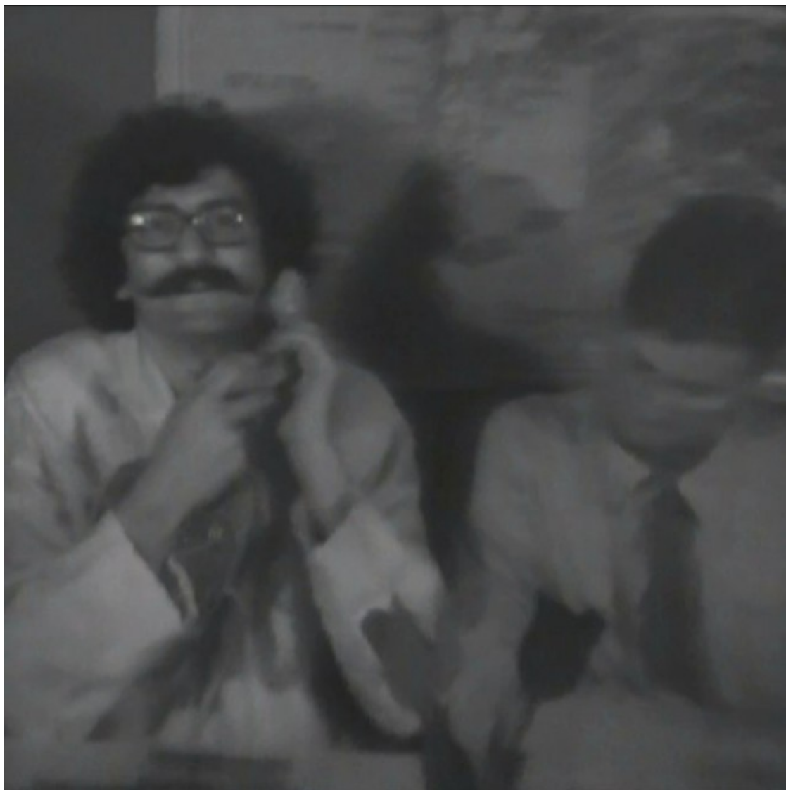
Imatge de Telediario Montesol-Onliyou, de Video-Nou