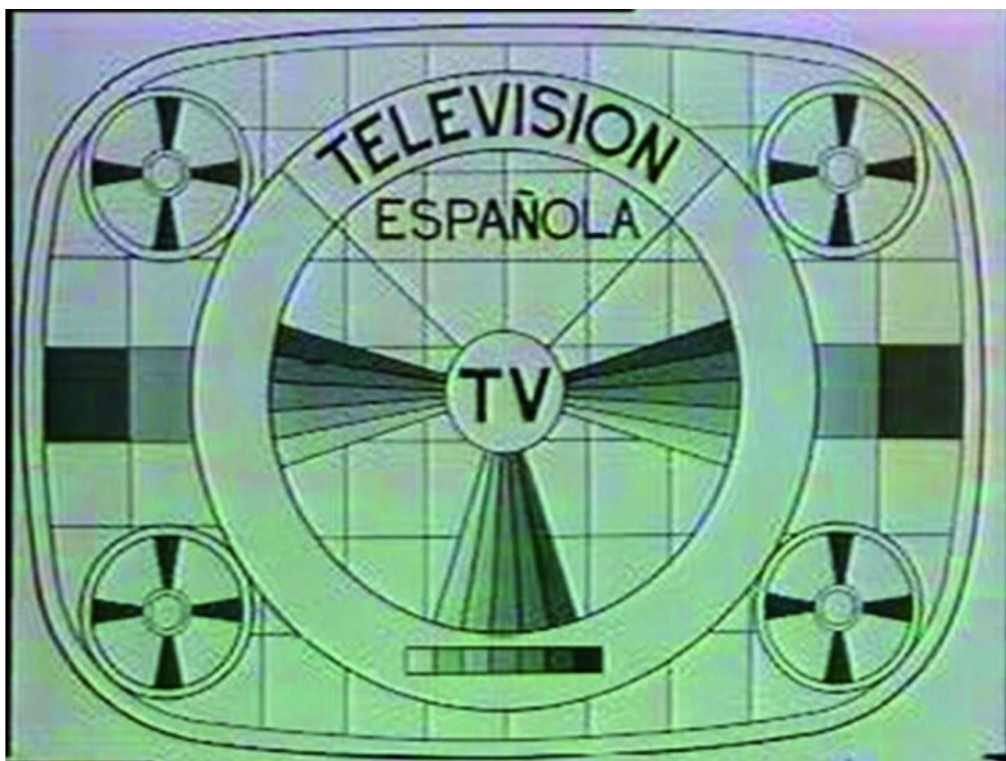
Imatge de TVE: primer intento

Per encàrrec del principal magazín d'art i cultura contemporànies del segon canal de Televisió Espanyola, Metròpolis, Muntadas i un equip de col·laboradors es van submergir en els arxius de TVE durant dos anys. Era 1988 i van trobar-los en un desordre absolut. Muntadas va enregistrar en vídeo l'estat d'abandó d'aquells materials i, alhora, va recuperar imatges del metratge de programes televisius del passat i va fer evident els paral·lelismes iconogràfics i de retòrica visual entre la imatge de Franco i la del monarca Joan Carles. El resultat va ser TVE: primer intento , i Metròpolis es va desentendre de l'encàrrec sense gaires explicacions.