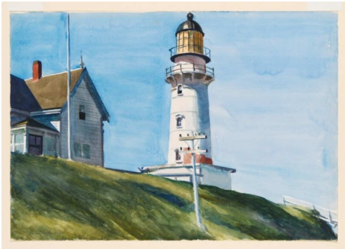
Autor: Edward Hopper (1882-1967).