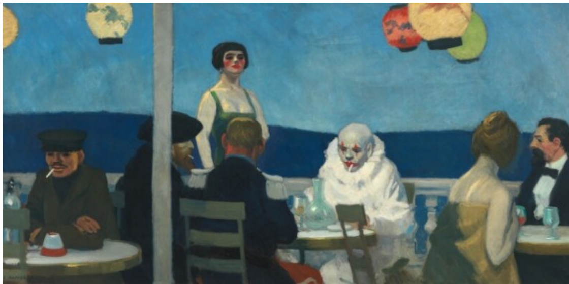
Autor: Edward Hopper (1882-1967).