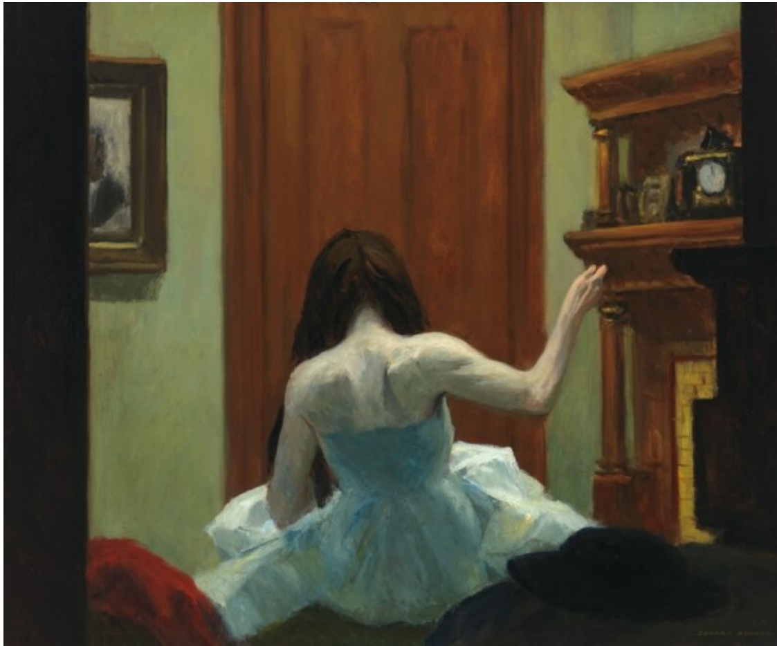
Autor: Edward Hopper (1882-1967).