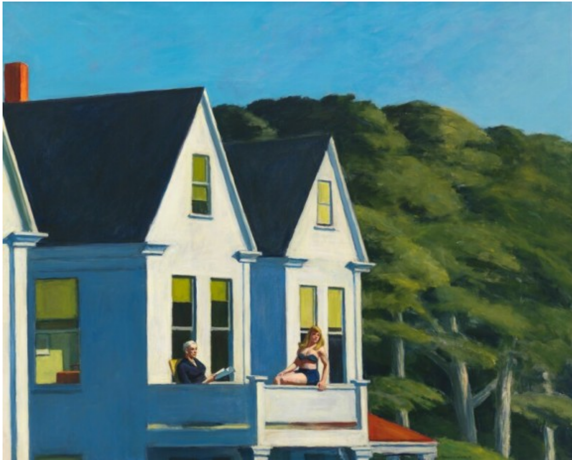
Autor: Edward Hopper (1882-1967).