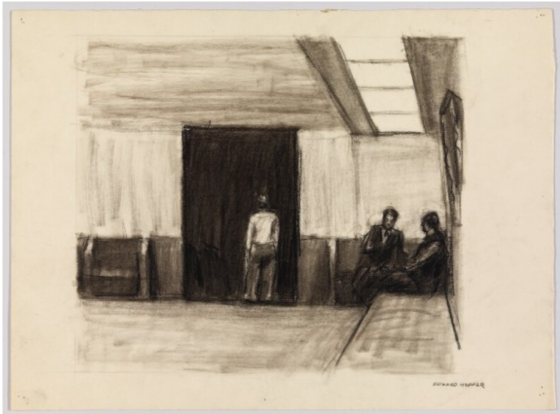
Autor: Edward Hopper (1882-1967).