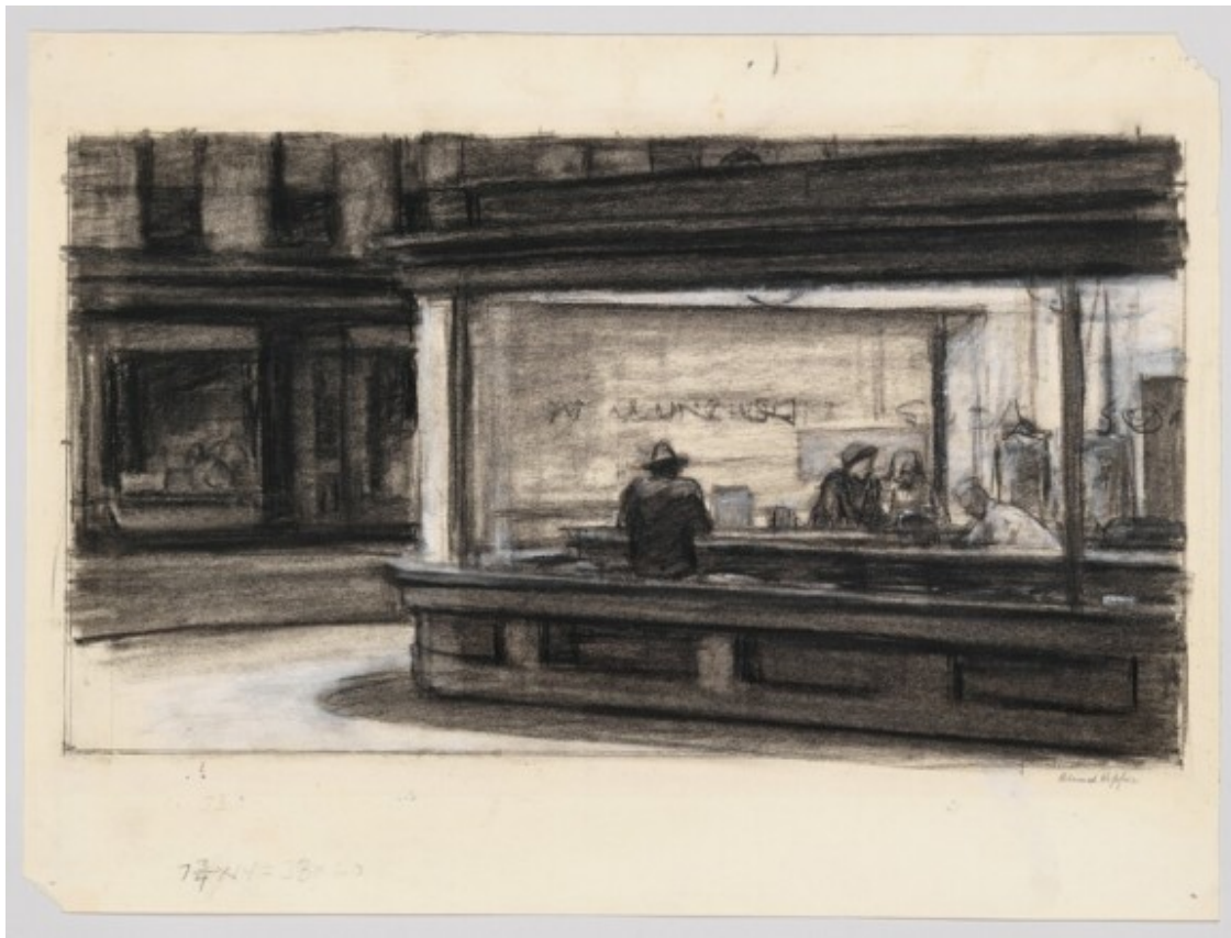
Autor: Edward Hopper (1882-1967).