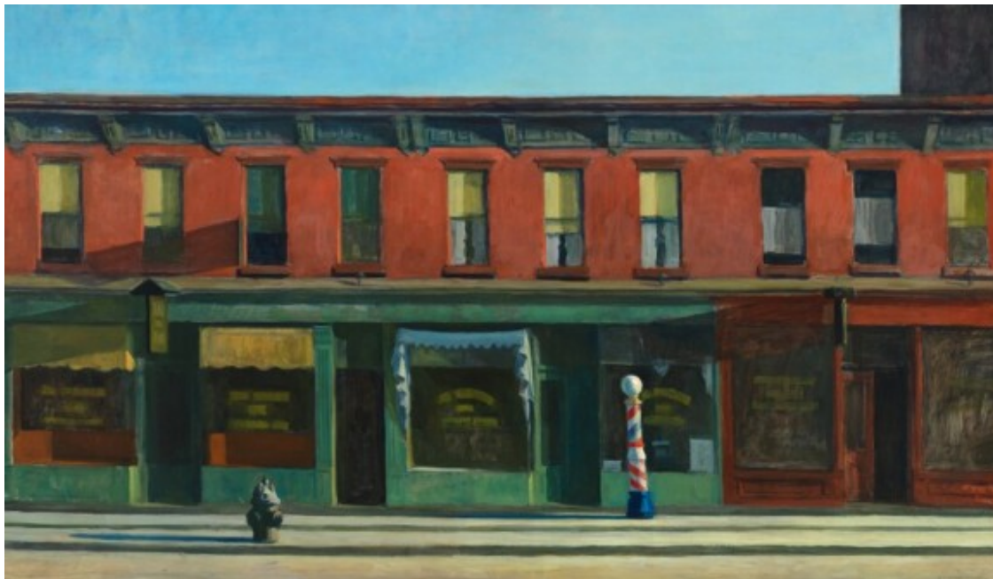
Autor: Edward Hopper (1882-1967).