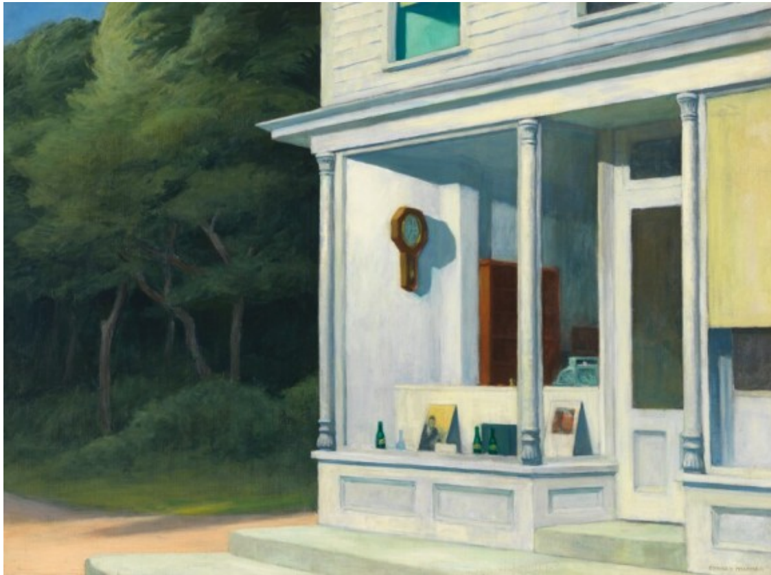
Autor: Edward Hopper (1882-1967).