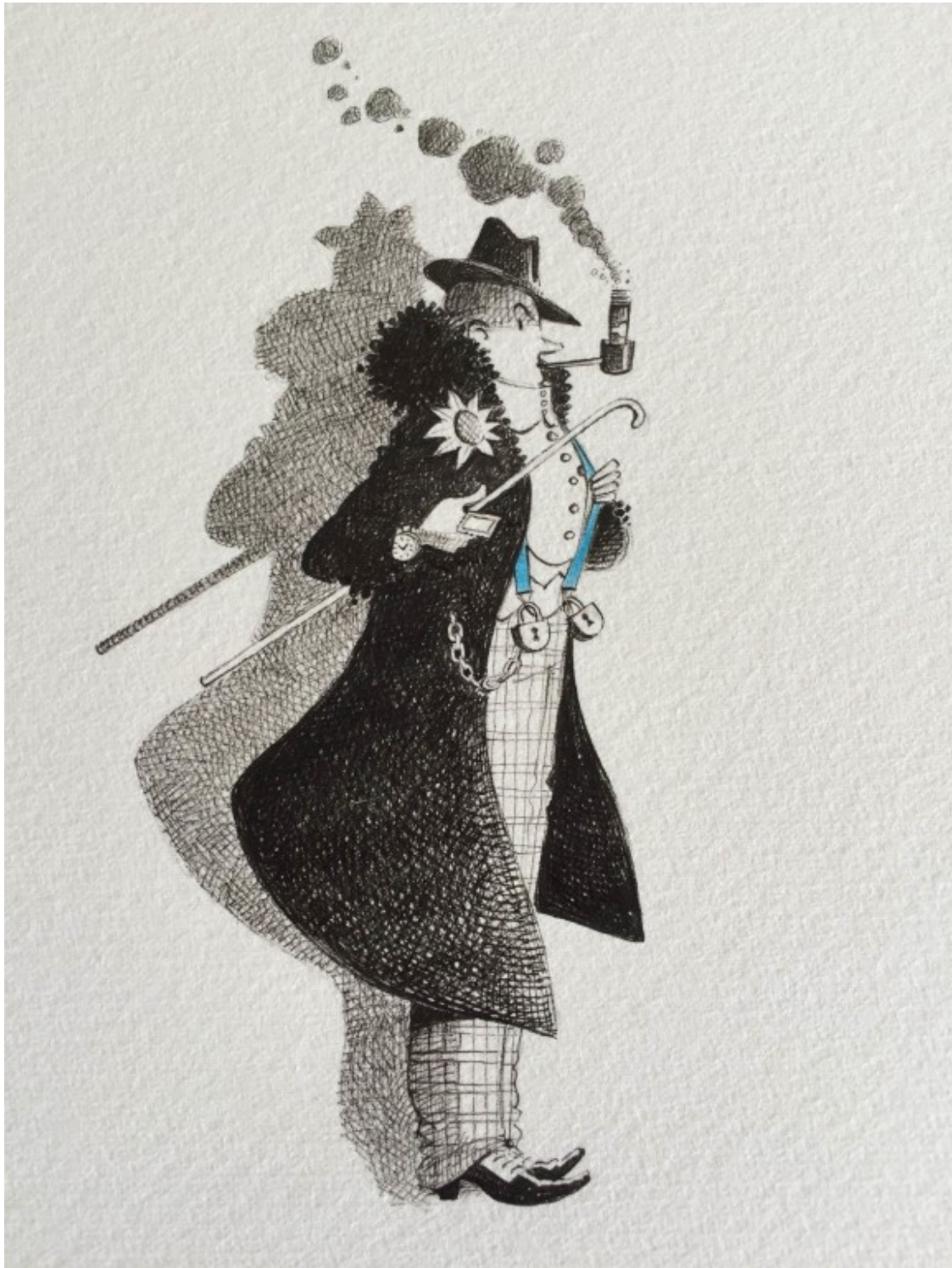
Il·lustració: Cristina Losantos

L'Àngel Casas ha participat activament en una pel·lícula antològica sobre la cançó catalana. Vaig sentir com deia, des de la televisió, que la cançó catalana havia de tenir una alegria i ésser eminentment popular. És una bona definició: tot fenomen cultural ha de ser