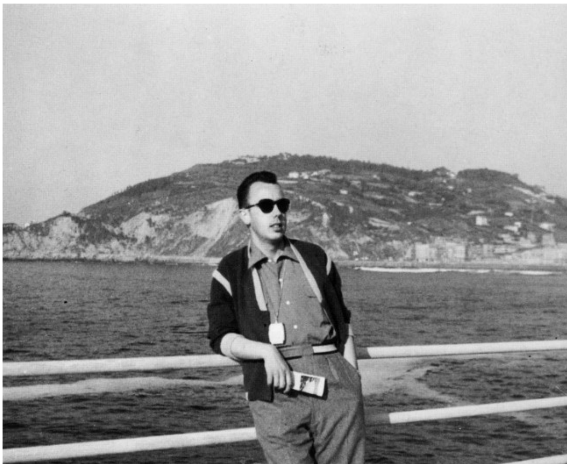
Miquel Martí i Pol.