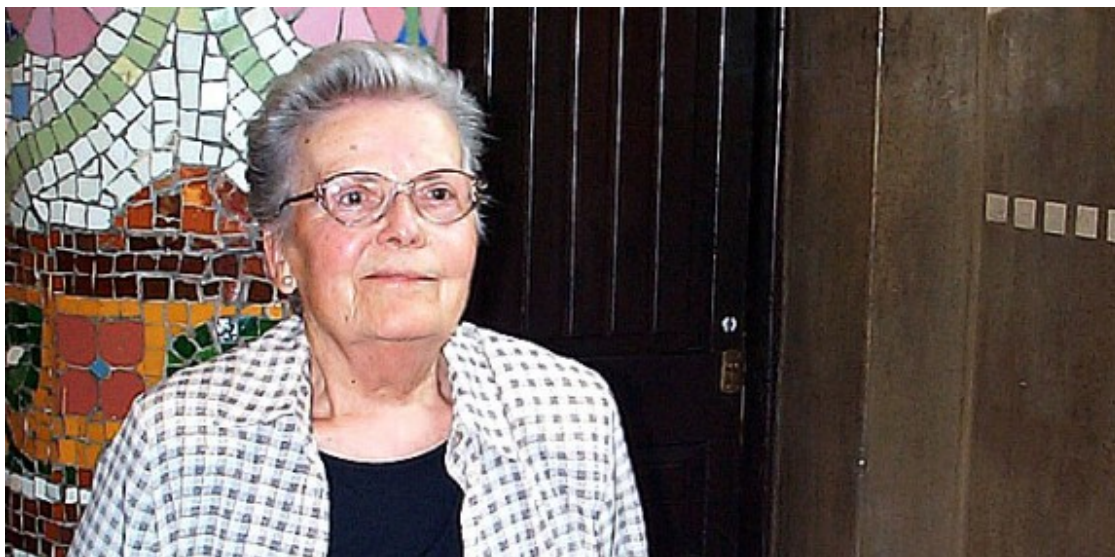
L'escriptora Teresa Pàmies en una imatge del 2001

Però, agraint-los els bons desitjos i els afectes que transmeten, desitjar-te noranta anys més potser és fer-ne un gra massa. A més, no sabria què fer-ne, de noranta anys extres. I, tanmateix, als col·legues de la residència els desitjo que compleixin els noranta si encara no ho han fet.