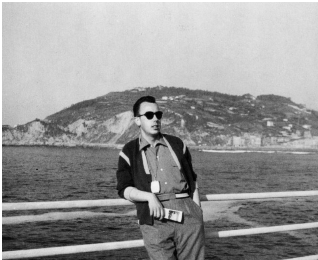
Miquel Martí i Pol.