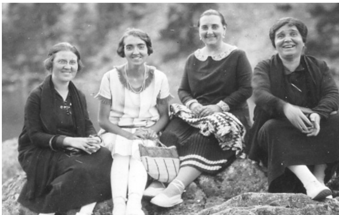
Àngels Ferrer (la segona per l'esquerra) d'excursió amb la seva mare (la quarta).

La pedagoga va morir el 30 de novembre del 1992 a Barcelona. La recordem llegint el seu missatge pòstum, cedit per l'Associació de Mestres Rosa Sensat ( http://www.rosasensat.org/ ), que va dedicar als mestres.