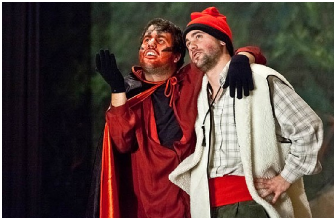
Els Pastorets de Montesquiú.

14. El pare va descobrir-se ell mateix que sí que era lo seu. Tant que amb el temps va arribar a estrenar una trentena d'obres de tres actes, o de cinc.