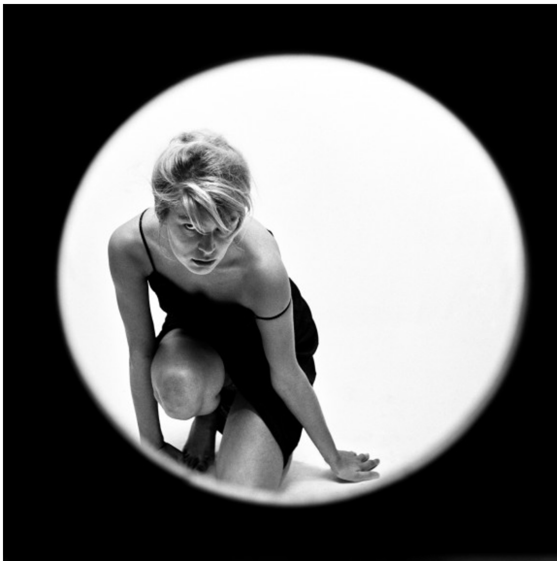
Finestra rodona 2, 1959

Recorrem de nou l'exposició «Leopoldo Pomés. Flashback ( https://www.lapedrera.com/ca/exposicions/fotografia/leopoldo-pomes-flashback ) », comissariada per Julià Guillamon, que va acollir a la Pedrera més de 140 fotografies i més de 50 espots publicitaris. Es tractava d'una retrospectiva completa del treball de Pomés, que comprenia des dels seus inicis vinculats al grup Dau al Set fins a l'actualitat.