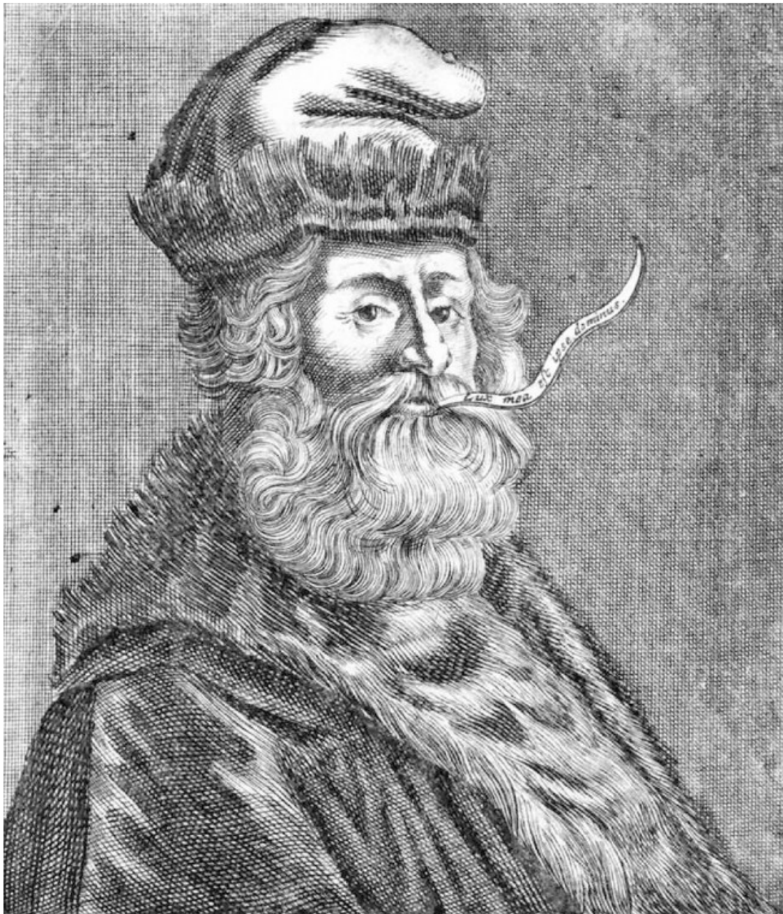
Ramon Llull.

El Palau Robert fa un repàs històric per la creativitat, l'enginy i l'emprenedoria més brillant