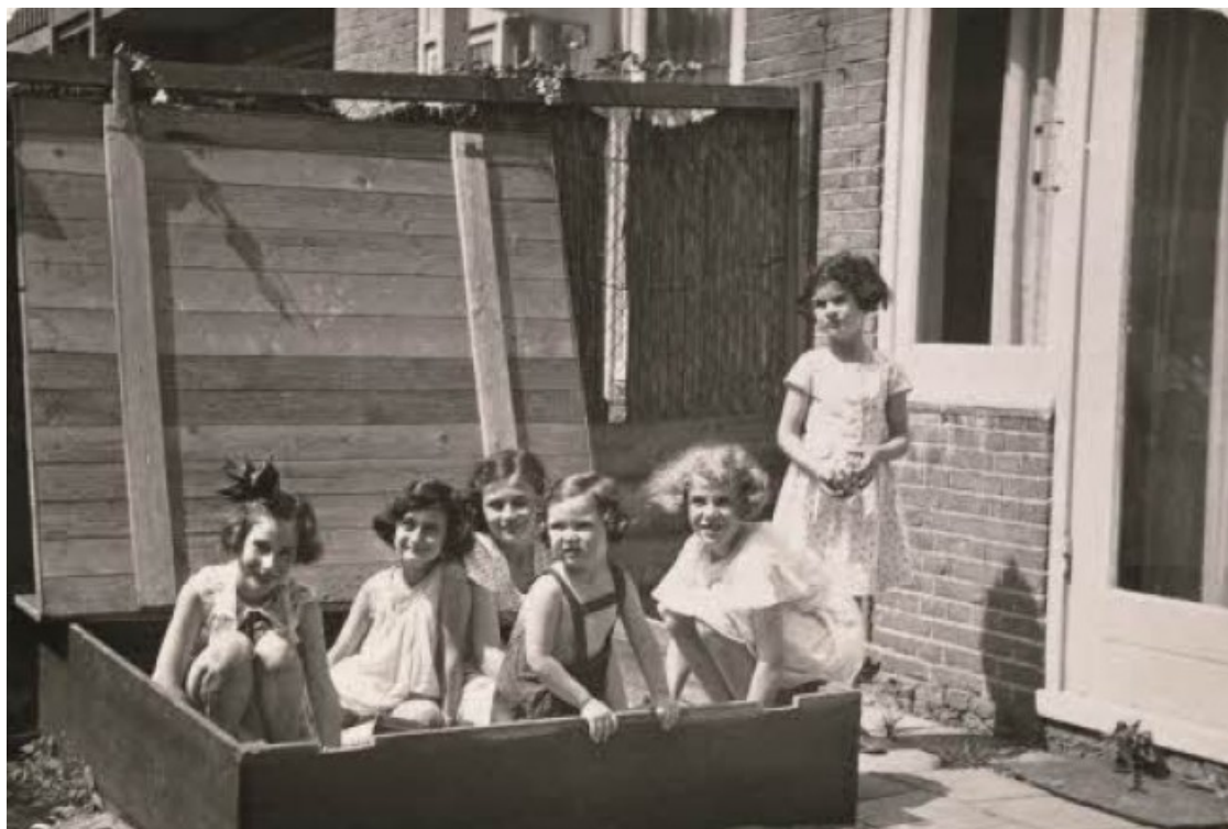
Anna amb unes amigues el juliol de 1937

Nosaltres quatre encara estem bé, i així hem arribat al dia d'avui, 20 de juny de 1942, data en què estreno el meu diari amb tota solemnitat.