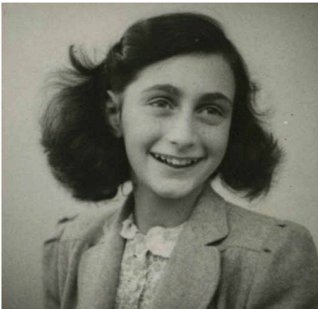
12 anys, maig de 1942.