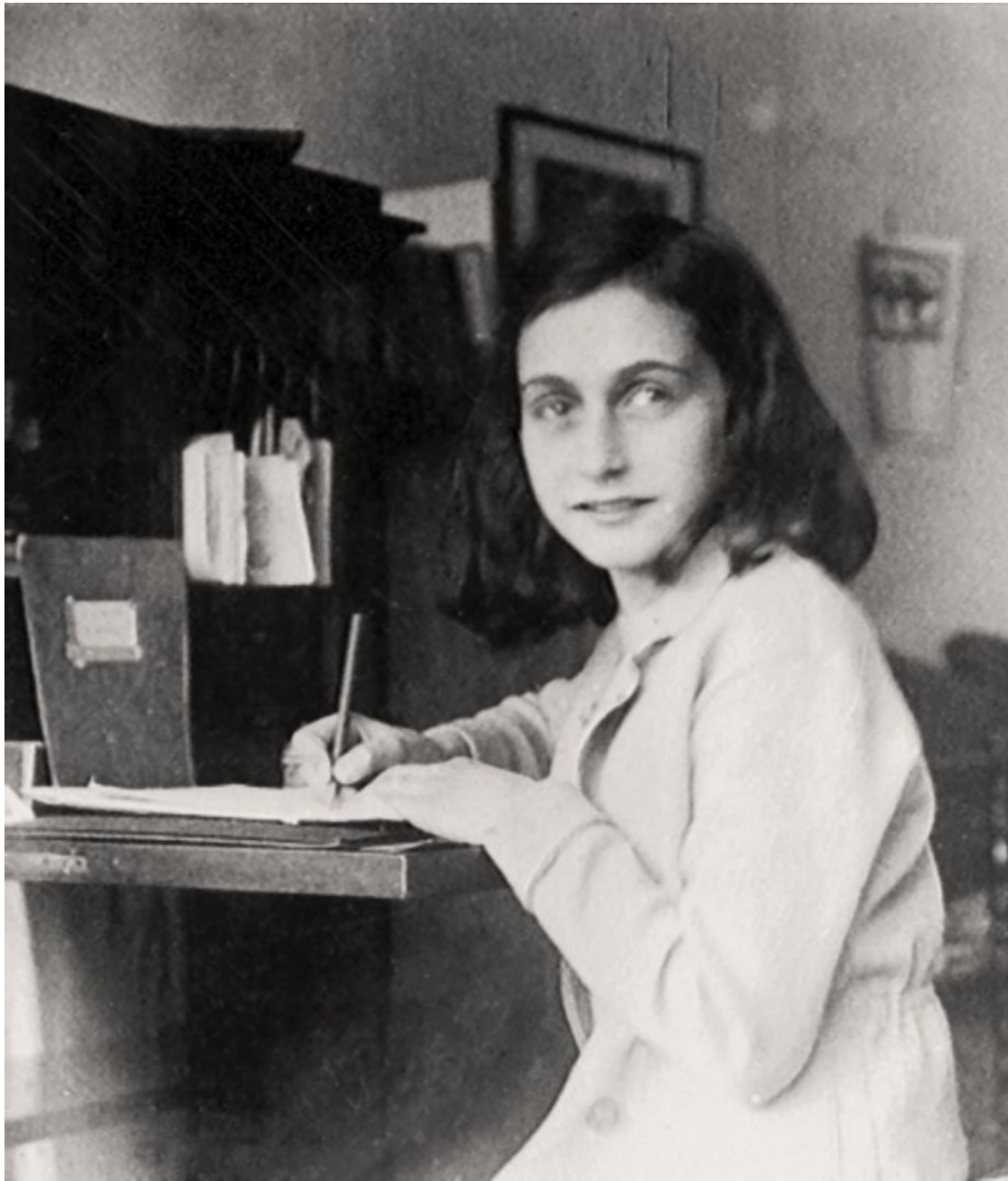
11 anys, 1941

El pare d'Anna Frank, Otto Frank, en una entrevista: V?deo: https://www.youtube.com/watch?v=AWRBinP7ans