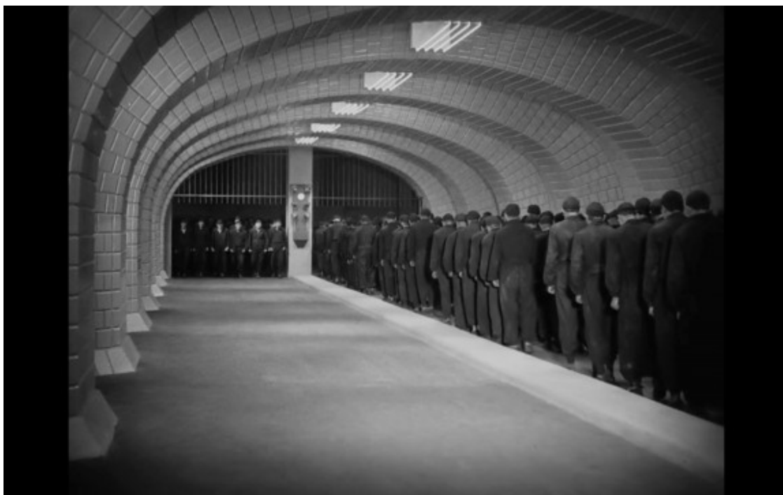
Primer pixaner. Segon rei del món.

A Metropolis , una de les primeres i més majúscules mostres de cinema de política-no-tan-ficció , se'ns retrata una societat estratificada de manera bipolar. A dalt, els qui ho controlen tot, fan i desfan vivint hedonísticament una utopia envejosa. A baix, els qui ho fan rutllar tot de manera mecànica. Hexàgon amunt, hexàgon avall, els obrers de Metròpolis són abelles sotmeses a l'artròpoda manera, inconscientment. Les abelles són obreres sense cap altre objectiu que no sigui aquest, treballar. Es posen en fila per fitxar, es posen en fila per creuar portes i es posen en fila per utilitzar ascensors. Es posen en fila per viure.