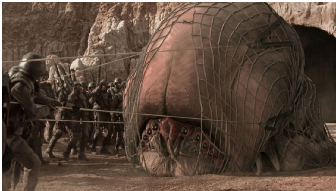
Coi de mamífers! Us foteu amb mi perquè no tinc braços.

Però no cal patir. Amb sang i suor i nus gratuïts la humanitat pot sobreposar-se fàcilment a la pèrdua de Buenos Aires conformant-se amb unes quantes llibertats menys i uns quants feixismes més. Perdent extremitats, acceptant treure'ns les botes i posant els líquids dins d'una bossa transparent en fascicles de 20 cl ens anem acostant, pas a pas, parsimoniosament, als obrers disciplinats de Metropolis , ens anem fent més i més insectes. De mica en mica, de control en control, de cessió en cessió de les llibertats, d'hexàgon en hexàgon anem construint el nostre propi rusc. Un rusc que percebem càlid, segur i ordenat. Un rusc imaginari que amaga i alhora ens protegeix del nostre monstre interior.