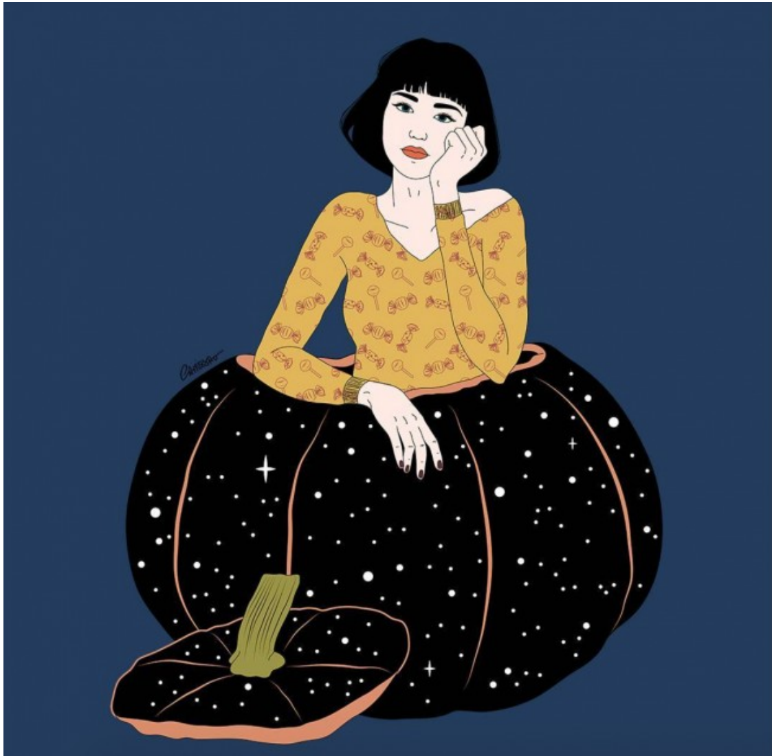
Il·lustradora: Camille Le Saulnier