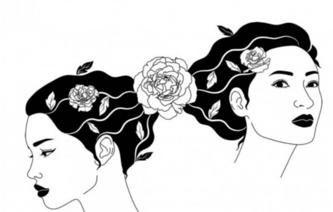
Il·lustradora: Camille Le Saulnier